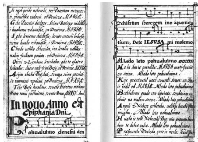
Prilog 3. Pavlinski zbornik 1644. (faksimilni pretisak, HAZU – Globus, Zagreb, 1991.), Pohvalujmo današnji dan

put zabilježeno upravo u Pavlinskoj pjesmarici 33 – primjerice Pohvalujmo današnji dan , popijevka In novo Anno et Epiphania Domini , koja je, smatra Kos, »stari hrvatski koledni napjev«. 34 (prilog 3.)