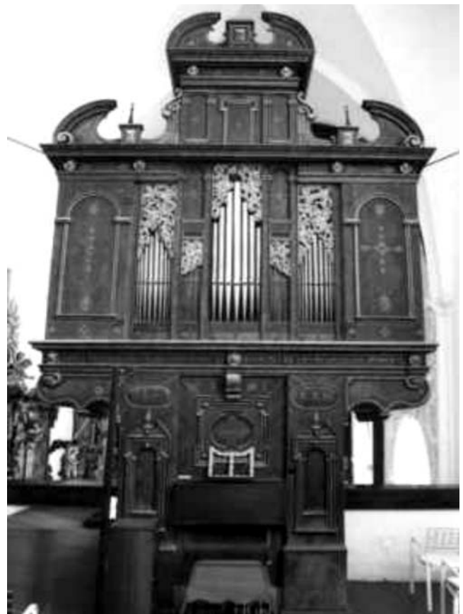
Prilog 4. Orgulje crkve Bezgrješnog začeca B. D. Marije u Lepoglavi ( http://www.zupa-lepoglava.hr/povijest.htm )