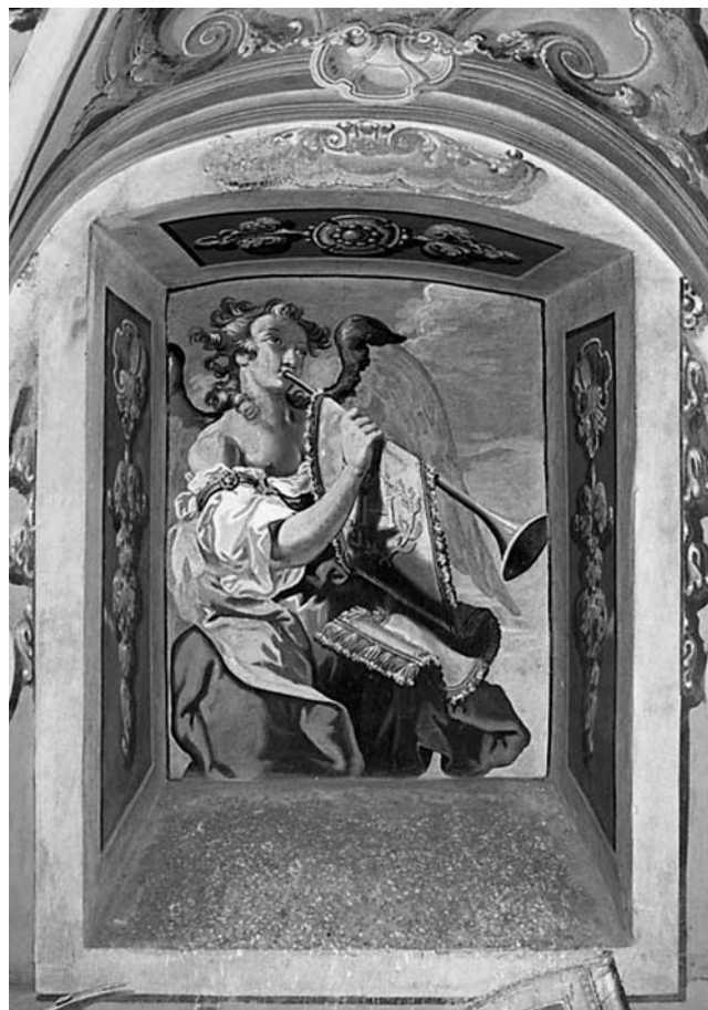
Prilog 2. Anđeo trubljač Ivana Krstitelja Rangera s freske crkve sv. Jeronima u Štrigovi

Da su pavlini jako držali do glazbe, pogotovo do crkvenoga pjevanja, dokazuju i konstitucije Reda. 6 Poglavlja de officio rectoris chori opisuje