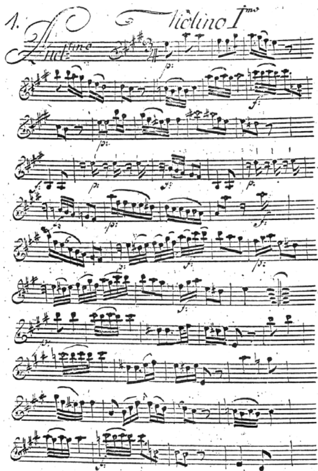
Prilog 5. Ivančić, Amando, Simfonija u A-duru , prva stranica dionice prve violine (Archiv der Gesellschaft der Musikfreunde in Wien, Ms. XIII 8550/gg) (preuzeto iz: Ivančić, Amandus, Simfonije za dve violini in bas , SAZU – Razred za zgodovinske in družbene vede – Znanstvenoraziskovalni center – Muzikološki inštitut (Monumenta artis musicae Sloveniae, 3), Ljubljana, 1984.

Ivančić je skladatelj koji zanima istraživače diljem Europe, a i njegova djela nalazimo raširena na raznim lokacijama: u Austriji, Belgiji, Češkoj, Hrvatskoj, Mađarskoj, Njemačkoj, Poljskoj, Sloveniji, Slovačkoj i Švicarskoj. 50 Ona su najbrojnija u Bratislavi u Slovačkoj, 51 zatim u Austriji. 52 U