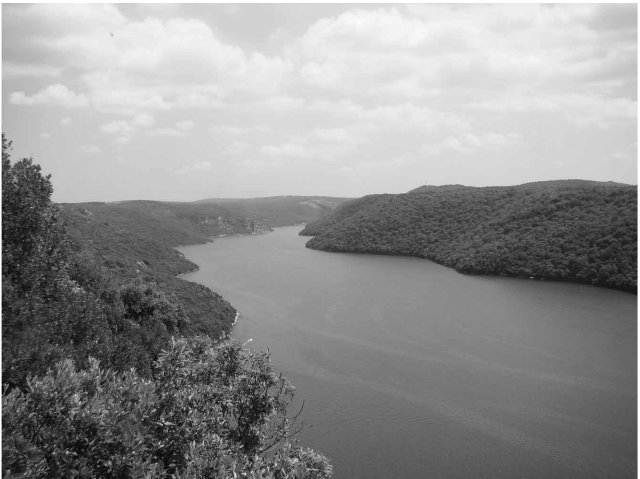
Slika 1. Panoramski prikaz dijela istraživanih crnikovih šuma uz Limski kanal Fig. 1 Panoramic survey of a part of the studied forests of holm oak along the Lim Fjord

Latinski nazivi biljnih vrsta usklađeni su prema internetskomu izvoru – Flora Croatica Database (2004) ( http://hirc.botanic.hr/fcd/ ). Korišteni nazivi šumskih zajednica (asocijacija) usklađeni su s međunarodnim kodeksom fitocenološke nomenklature (Weber i dr. 2000).