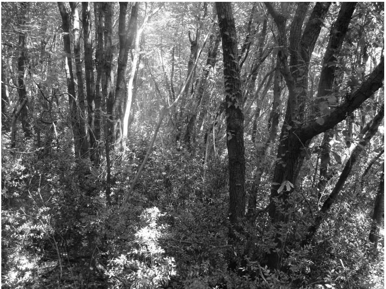
Slika 3. Karakteristični izgled istraživanih sastojina hrasta crnike s listopadnim elementima Fig. 3 Characteristic appearance of the studied stands of holm oak with deciduous elements

družju izostaje razdoblje suše u ljetnim mjesecima, što se odražava u udjelu listopadnih elemenata. Tako najveći broj listopadnih vrsta (13) pridolazi u sastavu šuma i makije sjevernoga područja.