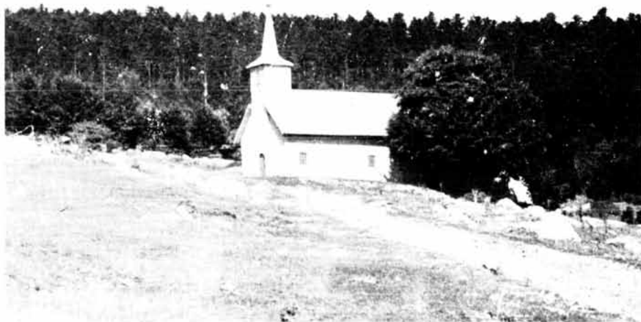
Slika 1. Crkva sv. Marije u Krasnu, staro zavjetno svetište u planini, snimak od jugozapada, A. Glavičić, 1968.