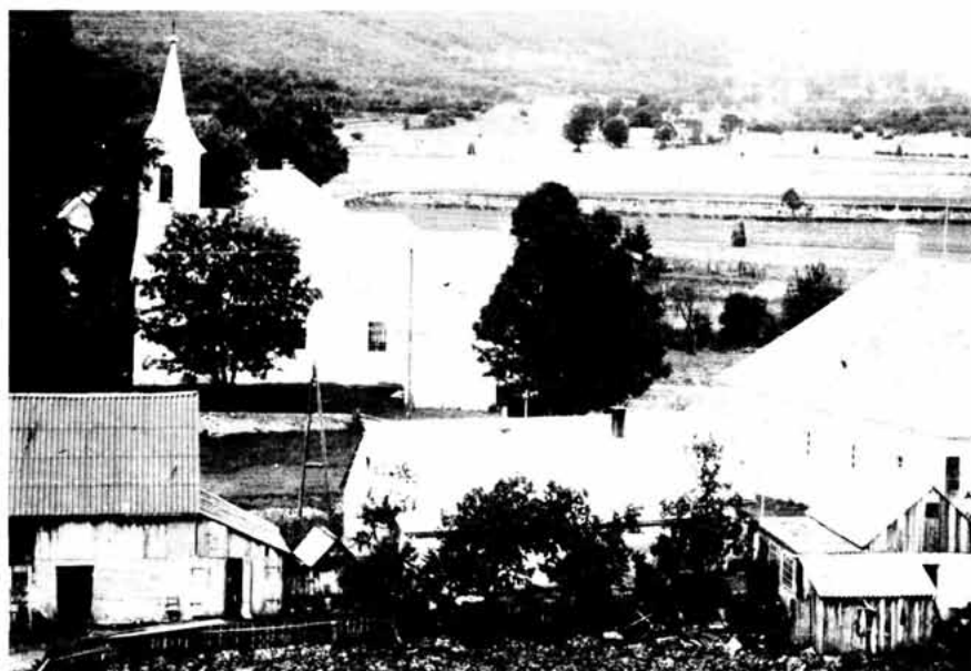
Slika 2. Župna crkva sv. Ante u Krasnu, desno župni dvor i seoske kuće, snimak od istoka, A. Glavičić, 1980.