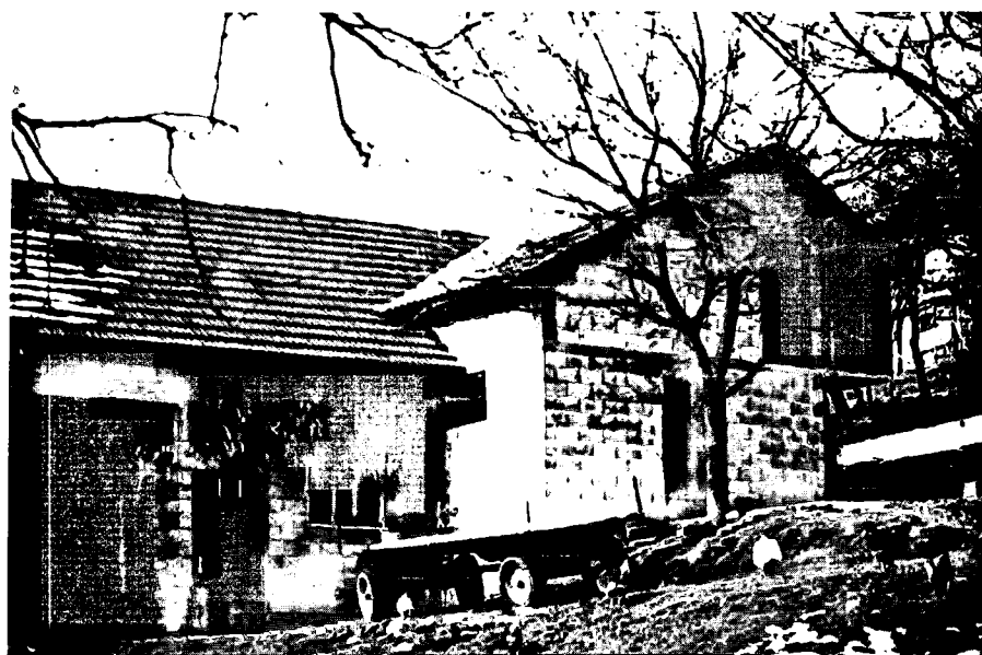
Slike 4 i 5: Gospodarska zgrada sa štagljem i štalom, Molvice kod Kerestinca.