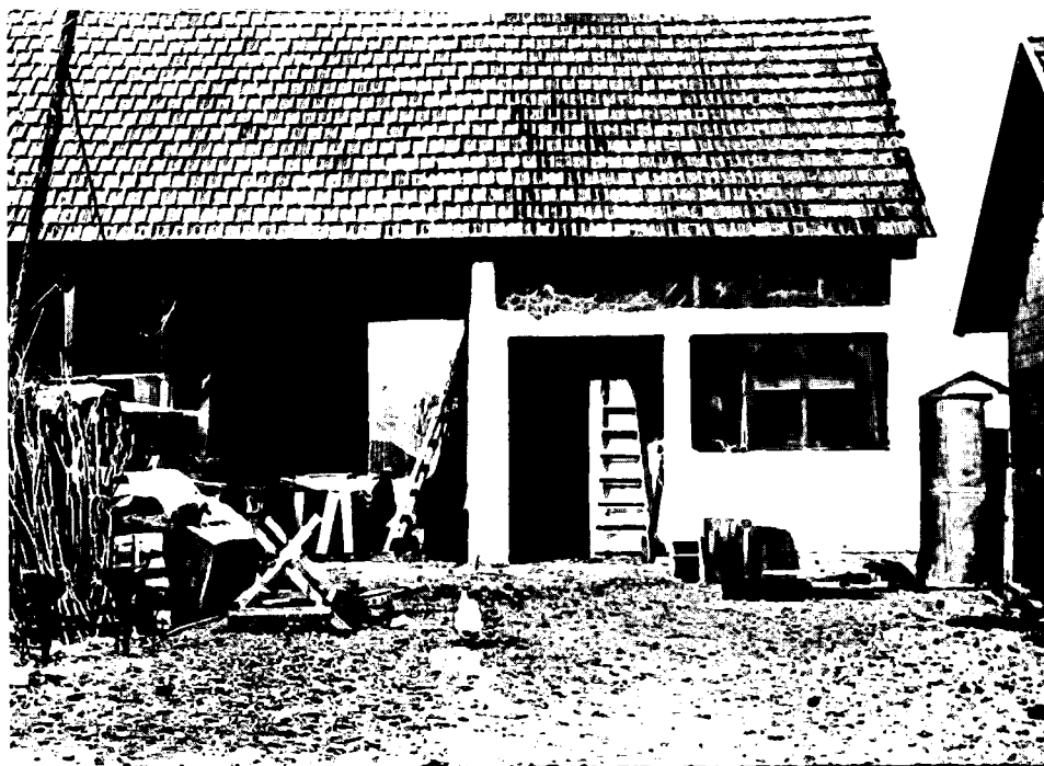
Slika 10: Gospodarska zgrada, Molvice kod Kerestinca