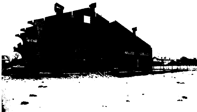
Slika 3: Obiteljska kuća u izgradnji, okolica Samobora.