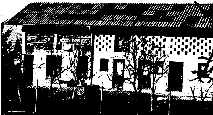
Slika 6: Gospodarska zgrada u okolici Samobora

Slika 6 pokazuje gospodarsku zgradu na kojoj je stvorena kompozicija sa otvorima različitog formata. Takav problem nije specifičan i nije čest u tradicionalnoj arhitekturi.