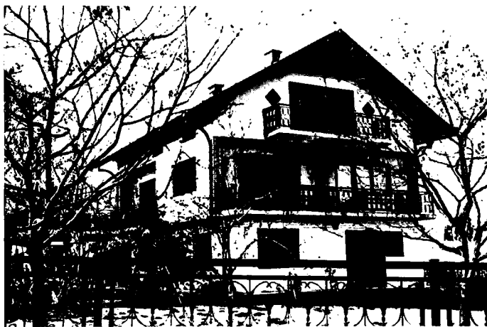
Slika 2: Obiteljska kuća u okolici Samobora

Noviji razvoj pokazuje nove oblike u degeneraciji te arhitekture: osnovne sheme kuća ostaju loše projektirana "profesionalna" arhitektura, ali se na nju dodaju obogaćenja u vidu pretenciozno projektiranih oblika i dekorativnih dodataka. To su dekorativna oploćenja kamenom ili keramikom na fasadama, različite žbuke, krovovi s prelazima u razne vrste mansardnih ili lažnih mansardnih oplošja, dimnjaci s dodacima, zidovi sa zaobljenim konzolama, dekorativne ograde itd. (Slike 2, 3)