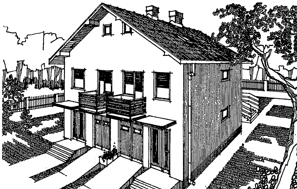
Slika 1: Projekt iz kataloga: dvojna obiteljska kuća; Katalog projekata "Naš stan", Beograd, 1988. s. 423

obavezali na nabavljanje građevnih dozvola i projekata za kuće. Međutim, ta nametnuta praksa nosila je, u vrijeme kada se počela širiti na selo, u sebi već bolesti pojednostavljenog, površno shvaćenog i degeneriranog modernog pokreta u arhitekturi. Tako degenerirana zahvatila je i nametnula se, na širokom prostoru narodnog graditeljstva, jeftinim tipskim projektima. (Slika 1)