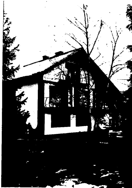
Slika 8: Obiteljska kuća u okolici Samobora