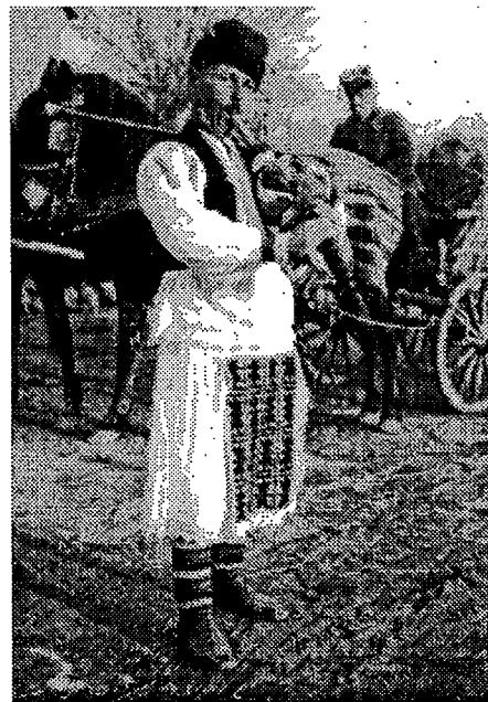
Gajdaš u svatovima