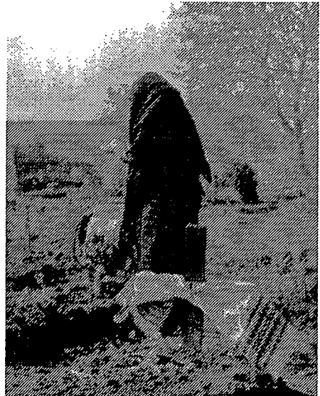
Sl. 4 Groblje, Draž. Foto: Damir Klasiček, 1973.