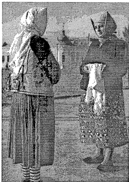
Sl. 1 Baranjke iz Luča u Osijeku. Foto: A. Puiš, 1953. godine.

Baranjke su i dalje uporno dolazile u Osijek jer im je trebao novac za preodijevanje. Prodavale su svoju nošnju i nakit svima koji su za to imali neki interes, a najbolji su kupci bile Bosanke. Kako je robe bilo u preobilju, tržište je trebalo proširiti. Gotovo se u svakom selu osposobila po koja žena ili muškarac za preprodavanje, sjećam se Kate iz Luča, Marka iz Branjinog Vrha, Kate iz Duboševice. Oni su proputovali cijelom bivšom Jugoslavijom nudeći baranjski etno-materijal - ne samo tekstil: muzejima, folklornim skupinama, trgovinama rukotvorina i pretršcima drugih nacionalnosti. Posljedice te trgovine biti će problem za one istraživače tradicijske kulture koji ne budu dobili ispravne podatke o podrijetlu, nego budu suočeni samo s tim materijalom u sredini kojoj ne pripada, a pojedinci ili nosioci budu tvrdili da je njihov. Takav slučaj bilježim s jednom folklornom skupinom na Omladinskom festivalu u Vukovaru, koja je nastupila u šumadinskim suknjama kompletiranim s baranjskim rubinama, tj. s oplečkom u funkciji bluze - za koju su članice te grupe tvrdile da je njihov rad. Međutim u rukovodstvu su mi potvrdili da su nabavljene otkupom iz Baranje.