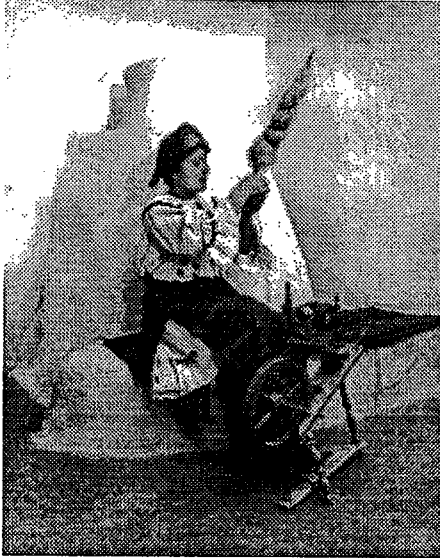
Sl. 3 Prelja, Draž. Foto: Damir Klasiček, 1973.

Ovom izboru manje poznatih kućnih radinosti dodajem djelovanje jednog obrtnika–kujundžije u Branjinom Vrh. Ja ga nisam zatekla, znam za njega samo iz kazivanja. Kod njega su Baranjke nabavljale srebrne obočiće , naušnice. A imale su cijelu seriju obočića i među njima neke u filigranskoj izradi. Je li taj kujundžija izrađivao sve: obočiće s krilci ; lopatice , tri zvonca ; male kandile ; velike kandile ; penavci ... ili samo pojedine vrste, treba ispitati.