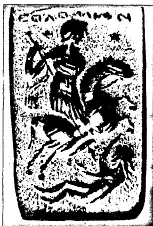
Gemma u Benaki muzeju, Atena. Prema: Piccirilli 1979.