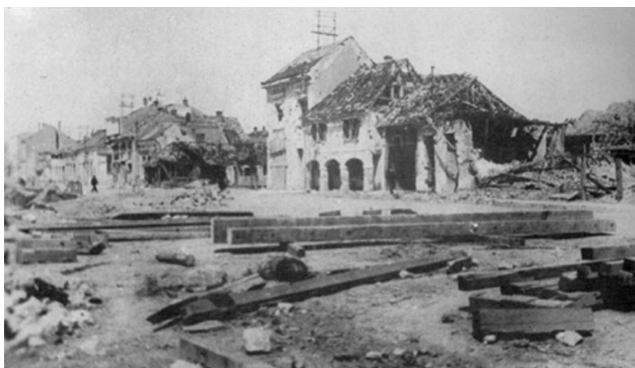
Radićeva obala u Slavonskom Brodu 1945.