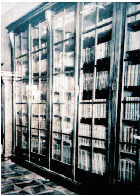
Slika 4. Fotografija biblioteke u Jurjevskoj ulici

– Mažuranić Ogulinu i što je on njoj. Od tvornih tragova ostala je gospodarska zgrada u dvorištu, danas neprepoznatljivo modernizirana u garažu Hrvatskih šuma. Zgrada Hrvatskih šuma, s bajkovitim medvjedom u ulazu, ali medvjedom drugog autora, nalazi se na mjestu srušene kuće. Na toj zgradi postavljena je, naknadno,