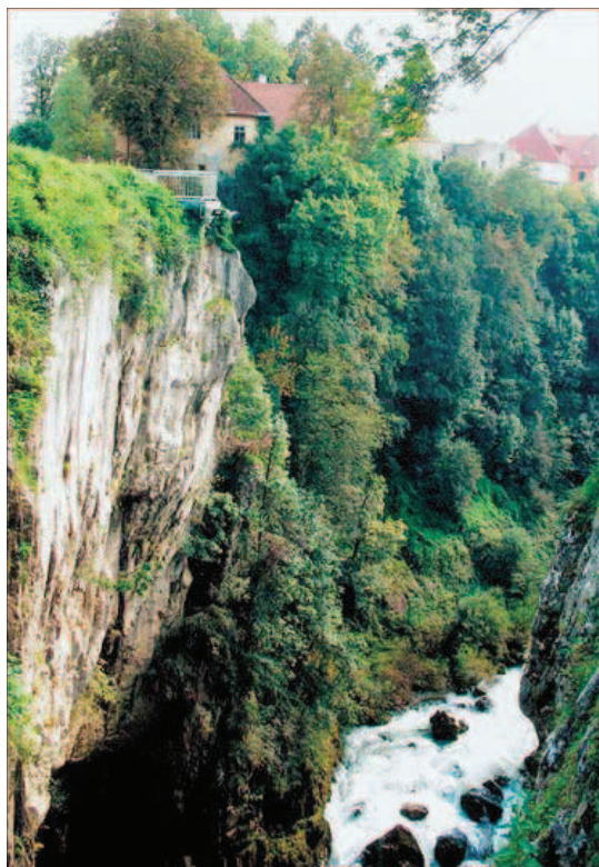
Slika 9. Đulin Ponor - ponor rijeke Dobre u Ogulinu

ponuda. Ali ako muzej književnosti ne uspostavlja stalan dijaloški odnos stvarnoga i izmišljenoga, upućujući neprekidno jedno na drugo i korigirajući jedno drugim – ako ne ljulja vlas stvarnosti