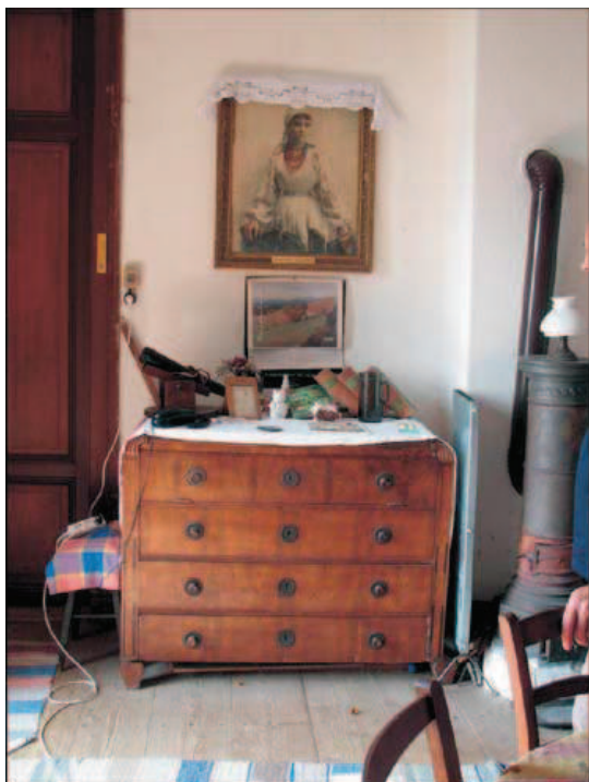
Slika 7. Autentični enterijer ljetnikovca iz vremena Ivane Brlić – Mažuranić