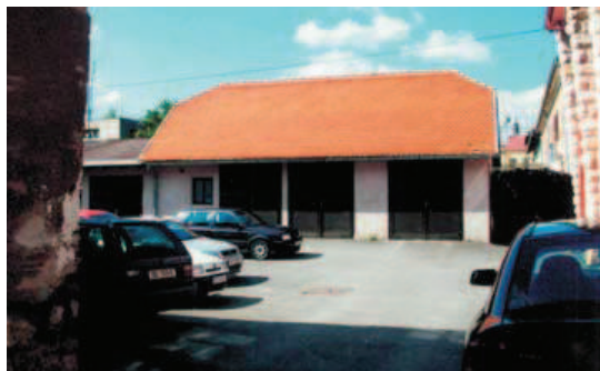
Slika 1. Nekadašnja gospodarska zgrada kuće Ivane Brlić Mažuranić, danas garaža Hrvatskih šuma

Muzej književnosti u najvećoj mjeri računa s nestvarnim svijetom. Dok se u ostalim muzejima pažnja usmjerava