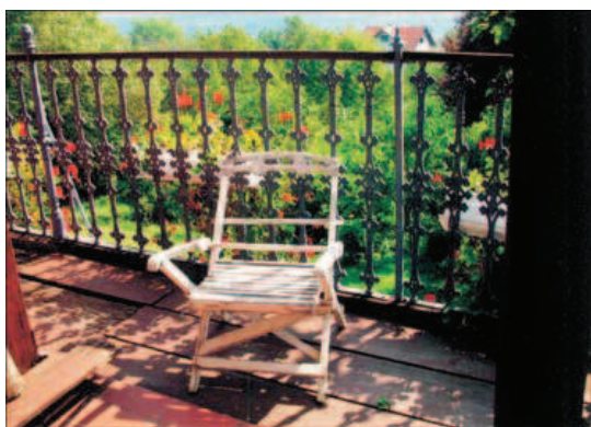
Slika 8. Pogled na terasu ljetnikovca

unatoč velikoj trošnosti i nemogućnosti odgovarajućeg održavanja, autentične predmete, namještaj u izvornom rasporedu, namještaj na kojem je, s mnogim slavnim gostima, sjedila Ivana Brlić – Mažuranić; ili onaj, sasvim krhak i potrošen, na terasi, s kojega je daljinu gledala još Ivanina svekrva, slikarica Fani Daubachy Brlić. Sve je to živo,