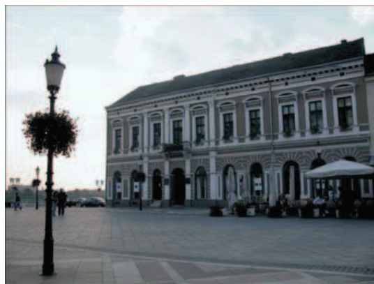
Slika 5. Kuća Brlićevih u Slavonskom Brodu

s porastom svijesti, spomen-ploča Ivani Brlić – Mažuranić. Nedaleko, na glavnom trgu, nalazi se i njezina bista. U muzeju u frankopanskom gradu uređeno je nekoliko spomen-soba Ivane Brlić – Mažuranić. One sadržavaju mnoge dokumente i fotokopije iz kojih doznajemo zanimljive podatke o našoj autorici. Na primjer, koja su joj sve krsna imena ili kako je glasilo Akademijino obrazloženje prijedloga da joj se dodijeli Nobelova nagrada. Na neke elemente iz tih oba imat ćemo prilike vratiti. Sve u svemu, dragocjena građa – jer je općenito tako nedopustivo oskudna – ali papirnata, suha, plošna, beskrajno siromašnija od bogatoga književničina djela. Pa čak bez onih elemenata koji su nužni za doživljaj njezine biografije kao drame – kakva je zaista i bola. Muzeificiranje Ivane Brlić – Mažuranić svođenje je njezina života na činovničku fusnotu čudesnoga opusa. I to je najsuvislije što o Ivani Brlić – Mažuranić kao muzeološki zahvat postoji.