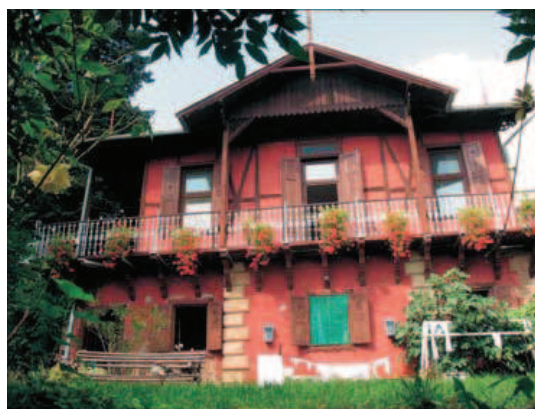
Slika 6. Ljetnikovac Brlićevih u Brdu, pokraj Slavenskog Broda

Slavonski Brod drugi put. Posljednji preostali autentični prostor života Ivane Brlić – Mažuranić, ljetnikovac Brlićevac u Brdu, u brodskom vinogorju. Taj romantični ljetnikovac iz druge polovice XIX. stoljeća, koji još živi u kontinuitetu i u kojem boravi unuk Ivane Brlić – Mažuranić, dr. Vuk Milčić, sa suprugom i potomcima, sadržava