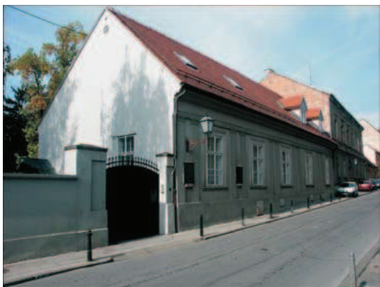
Slika 3. Zgrada obitelji Mažuranić u Jurjevskoj ulici, danas Španjolska ambasada

– Mažuranić Ogulinu i što je on njoj. Od tvornih tragova ostala je gospodarska zgrada u dvorištu, danas neprepoznatljivo modernizirana u garažu Hrvatskih šuma. Zgrada Hrvatskih šuma, s bajkovitim medvjedom u ulazu, ali medvjedom drugog autora, nalazi se na mjestu srušene kuće. Na toj zgradi postavljena je, naknadno,