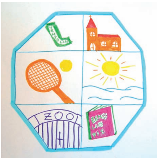
Slika 3. Crtež djevojčice oboljele od astme, koja je dobro kontrolirana i ne remeti značajnije kvalitetu njezina života. Na upit kako doživljava svoju bolest djevojčica se izrazila crtežom. Astma je samo djelić njezina života, njezina osobnost uključuje puno više.

U liječenju djece s astmom vrlo je važan izbor odgovarajućeg "inhalera" i pomagala, ovisno o dobi djeteta, suradljivosti, težini simptoma itd. Svakako se u djece preferira inhalacijska terapija, jer je povezana sa značajno manje nuspojava. Gotovo svako dijete može dobiti inhalacijski pripravak, uz pomoć pomagala. Na slici 2. prikazana je primjena inhalera (pumpice) preko zračne komorice (pomagala). Izbor odgovarajućeg pomagala direktno je povezan s učinkovitošću terapije, a indirektno smanjuje rizik od nuspojava (39, 54). Primjena inhalacijske terapije preko komorice za udisanje poboljšava depoziciju lijeka u plućima te smanjuje rizik od nuspojava. U komorici se zadržavaju velike čestice koje bi se inače zadržavale u ustima, tj. u orofarinksu, čime se smanjuje pojavnost lokalnih (oralna kandidijaza) i sustavnih nuspojava (manja bioraspoloživost lijeka). Primjena inhalera s pomoću komorice za udisanje nužna je u djece tijekom egzacerbacije astme. U teškoj egzacerbaciji astme u djece preferira se primjena lijeka s pomoću raspršivača, iako i primjena s pomoću komorice