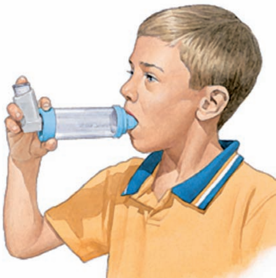
Slika 2. Primjena inhalacijske terapije preko značne komorice

Zadnjih godina u djece, kao i u odraslih, posebno je izdvojen fenotip astme koja se teško kontrolira i liječi, tj. teške