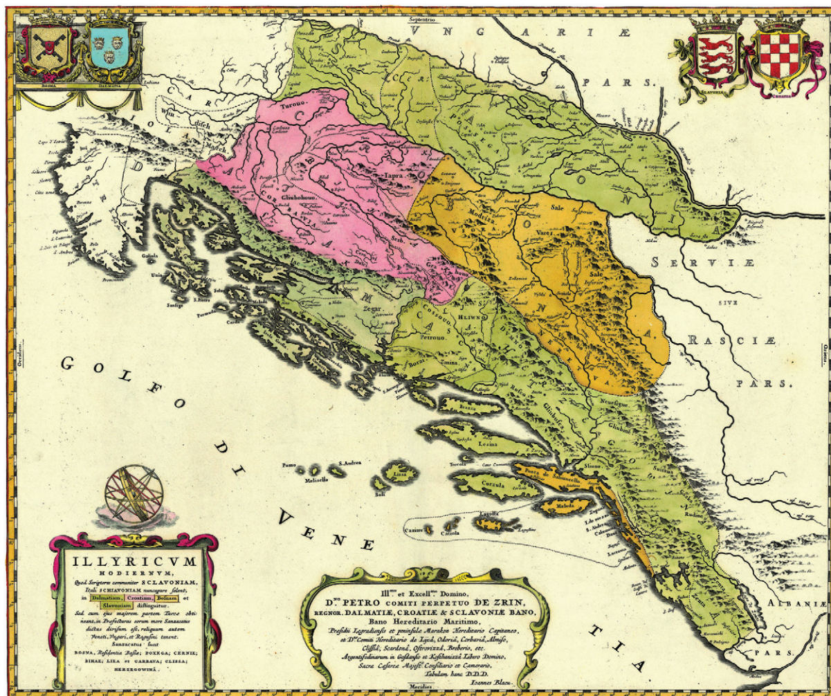
Slika 10. Lučićeva karta Današnjeg Ilirika, objavljena u: J. Blaeu, Atlas Maior , 1669. (Zbirka Novak, sign. ZN-Z-XVII-BLA-1669)

Figure 10 Lučić's map of present-day Illyria, published in: J. Blaeu, Atlas Maior , 1669 (Novak Collection, sign. ZN-Z-XVII-BLAH-1669)