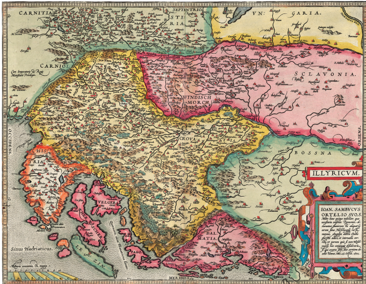
Slika 4. Sambucusova karta Ilirika, 1572. (Zbirka Novak, sign. ZN-Z-XVI-SAM-1572a) Figure 4 Sambucus' map of Illyria, 1572 (Novak Collection, sign. ZN-Z-XVI-SAM-1572a)

Boreali koju je Jan Jansson objavio u zbirci Atlas Maritimus, Seatlas oder 'Wasserwelt unutar atlasa Atlas novus (Amsterdam, 1650.) i karta Tafel der Stätte und Herschaften Zara und Sebenico in Dalmatia gelegen, allwo die Venediger dem Türckhen unterschiedliche veste Örther abgenom(m)en in Jahr 1646. und 47 koju je objavio Matthaeus Merian 1647. u djelu Theatri Europaei (Frankfurt, 1647.; KOZLIČIĆ, 1995.; MLINARIĆ, 2011.).