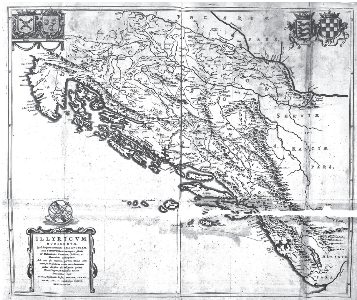
Slika 9. Lučićeva karta današnjeg Ilirika, objavljena u: I. Lučić, De Regno Dalmatiae et Croatiae , 1668. (Nacionalna i sveučilišna knjižnica, sign. R-II-F-4o-46/a)

Figure 9 Lučić's map of present-day Illyria, published in: I. Lučić, De Regno Dalmatiae et Croatiae , 1668 (National and University Library in Zagreb, sign. R-II-F-4o-46/a)