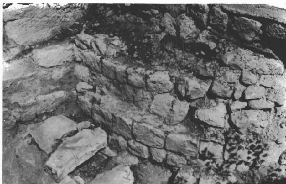
Sl. 6. Proložac-seosko groblje, dio slučajno otkrivene crkvene apside i groba. — Proložac, Dorffriedhof, Teil einer zufällig entdeckten Kirchenapsis und eines Grabes