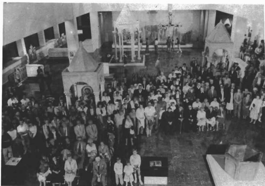
Sl. 8. Pogled na dio izložbenog prostora i uzvanike prigodom otvaranja izložbe »Blaž Jurjev Trogiraniin.« — Blick auf einen Teil des Ausstellungsraums und der Gäste bei der Eröffnung der Ausstellung »Blaž Jurjev Trogiraniin«