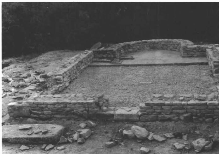
Sl. 4. Otres-Lukačuša, romanička crkva u toku konzervacije. — Otres-Lukačuša, die romanische Kirche während der Konservierungsarbeiten