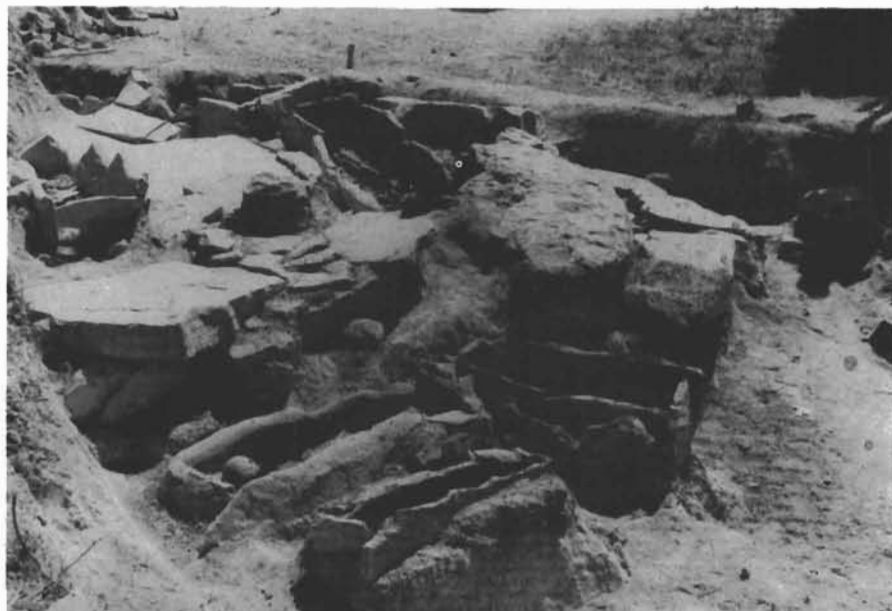
Sl. 1. Šopot-Crkvina, dio otkrivene nekropole u godini 1985 — Šopot-Crkvina, Teil des im Jahr 1985 ausgegrabenen Gräberfeldes