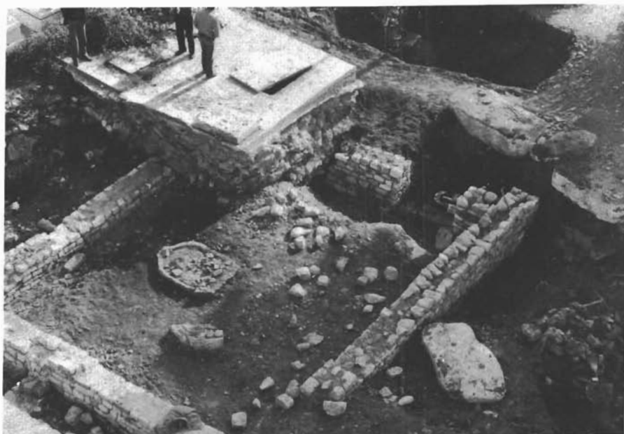
Sl. 5. Muć Gornji-Sv. Petar, otkriveni ostaci arhitekture s djelomičnom konzervacijom. — Muč Gornji, Hl. Petrus, ausgegrabene Architekturreste mit teilweiser Konservation