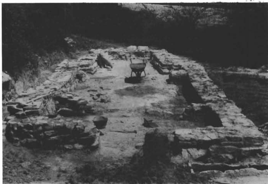
Sl. 2. Šopot-Crkvina, istražena crkva u toku konzervacije 1986. god. — Šopot-Crkvina, die erkundete Kirche während der Konservierungsarbeiten