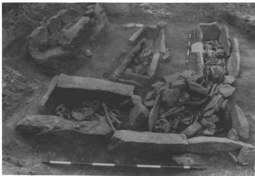
Sl. 3. Šopot-Crkvina, dio istraženih grobova u godini 1986. — Šopot-Crkvina, Teil der im Jahr 1986 untersuchten Gräber