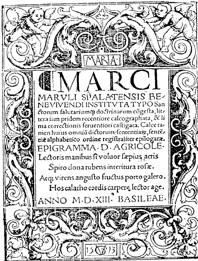
Document 2: Première page de l'Institutio, édition Bâle, 1513.