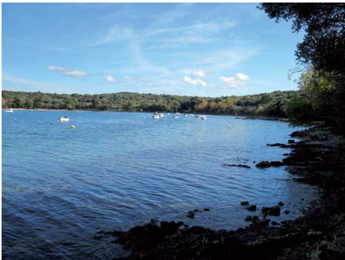
Slika 2. Južna obala Veštra (L. Bekić).

Nalazi novca iz Veštra imaju vrlo mali stratigrafski značaj. Većina njih je slučajni nalaz, a oni iz iskopavanja nisu pronađeni in situ u nekom znakovitom sloju. Što se tiče njihovog rasporeda duž obale može se reći kako je najviše novca pronađeno na južnoj obali uvale i to posebice na kamenitom srednjem dijelu, a nešto manje bliže šljunčanom vrhu uvale ili na južnom rtu. Na južnoj obali u zemljanom profilu zamijećuje se velik broj zidova i tu je očito bilo naselje. Poneki pronalasci novca dublje u uvali mogu svjedočiti o kretanju po poljima, ali ne može se isključiti postojanje gospodarskih i stambenih zgrada na ovom mjestu. Na južnom rtu su zabilježeni nalazi ranoantičkih paljevinskih grobova u komorama ograđenim kamenim pločama ili tegulama. S obzirom na to kako je more ispiralo grobove koji se nalaze bliže obali, i tu se pokatkad mogu pronaći raniji primjerci novca. 5 Na tom mjestu pronađeni su novac broj 2 i 3, za koje se može pretpostaviti da su bili grobni prilozi u 1. i 2. st.