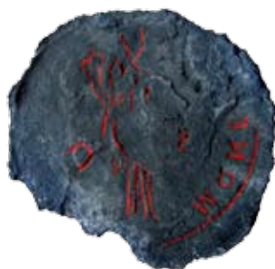
Slika 1. Otisak reversa novca broj 634 na unutrašnjoj strani tvrde kore korozije.

U ovom skupu vjerojatno najraniji novac je jedan u potpunosti istrunuo bakreni as (kat. 1). Pronađen je prilikom podvodnog arheološkog istraživanja rimske luke u Veštru 2011. g. Novac je očuvan samo u komadu korozije, a kada je prelomljen po sredini, otkrio se otisak nekadašnjeg lica i naličja u negativu. 3 Prepoznaju se noge boginje kao i natpis Mone(ta Avgvsti) S C, a kovanica je u dimenziji brončanog asa. Najvjerojatnije je riječ o asu Domicijana koji je vrlo često kovao novac s ovakvim reversom. Moguće je riječ i o nekom drugom vladaru prve polovine 2. st. kao što su Antonin Pije ili Hadrijan, koji su također kovali ovakav novac.