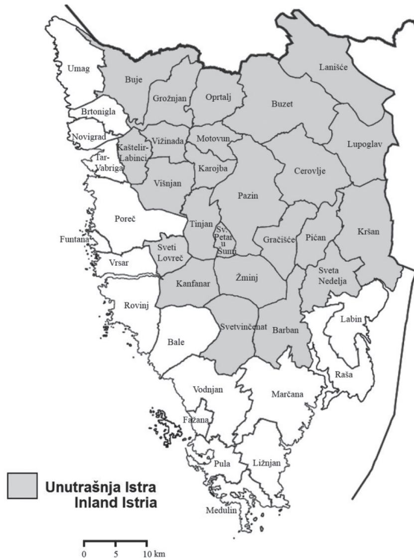
Slika 1. Upravno-teritorijalna podjela Istarske županije