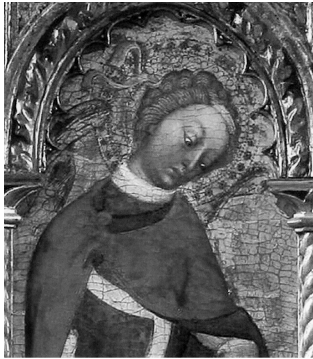
Blaž Jurjev, Arhanđel Mihovil s velikog poliptiha iz crkve sv. Ivana Krstitelja, Muzej sakralne umjetnosti u Trogiru

Iako nam nije poznat izvornik tog prijepisa doznajemo vrijedne podatke o izgledu temeljnih svetinja trogirске stolnice, a to su bista s dijelom lubanje sv. Ivana, ruka koju podržava anđel i starije ruke ukrašene filigranom iz kojih su kosti izvađene i poslije zamijenjene člancima prstiju.