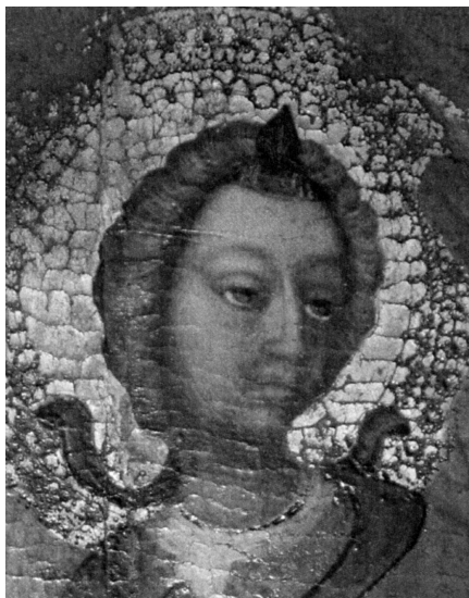
Blaž Jurjev, Detalj arhanđela Mihovila s poliptiha trogirskih dominikanaca

Na fino oblikovanom licu anđela s velikim zaobljenim plohama visokog čela i punih obraza ističu se izduženi nos i male tanke usnice. Detaljno su urezane lučno zasvedene obrve, a oči oblikovane sa stanjenim krajevima, velikim kopcima i naglašenim šarenicama. Ispod uvojaka kose samo vire ušne resice. Vrlo detaljno plastično oblikovani uvojci s blagim razdjeljkom i trokutastim pramenom na vrhu valovito uokviruju lice. Relativno veliki dlanovi izlažu i prikazuju svećevu relikviju u naknadno izrađenoj kutijici. Kapsela urešena rokoko oblicima nastala je 1756. godine kao i srebrna aureola sa spužolikim i školjkastim motivima. 44 Izdužena techa proširenih krajeva i uzdignute sredine urešena je motivima rokaja i florealnim ukrasima (41 x 12 x 8 cm). Na sredini su dvije glavice anđela nadvišene ružom, motivi oblaka i voluta dijelom su pozlaćeni, a na krajevima je vijenac cvijeća i voća.