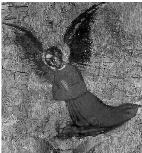
Blaž Jurjev, Bogorodica u ružičnjaku, detalj anđela, Muzej sakralne umjetnosti u Trogiru

Figura anđela sastavljena je od više spojenih dijelova. Posebno su izrađeni: glava, ruke, dlanovi, trup i donji dio lika s postamentom. Cvito Fisković je iznio hipotezu o ikonografskoj reinterpetaciji srebrne figure, smatrajući da je zamijenjena glava, prilagođen položaj ruku i dodana krila, naime da je lik sv. Lovre u odjeći đakona preoblikovan u anđela nosača relikvije. 41 Ugovor sklopljen 23. listopada 1446. godine s majstorom Tomom to osporava, precizno opisujući narudžbu i potvrđujući izvorni izgled relikvijara uobličenog prema tradiciji da je »sveta ruka angelskim načinom donesena«. 42