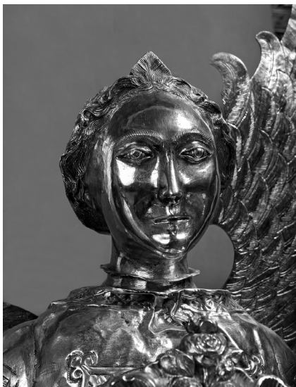
Glava anđela zlatara Tome Radoslavića

Kada je C. Fisković istakao razliku između lica i ruku anđela i njegove odjeće, zapravo je prepoznao specifičnost u kvaliteti srebra inkarnata i ruha, a upravo je to bilo uvjetovano narudžbom. Tekst ugovora potvrđuje da se ne radi o adaptaciji lika sv. Lovre u đakonskoj dalmatici već o anđelu nosaču moći sveca, koji je odjeven u đakonsko odnosno svećeničko ruho. Disproporcija između visine lika i dužine njegovih ruku uvjetovana je veličinom relikvije i srebrne teche koju je nosio.