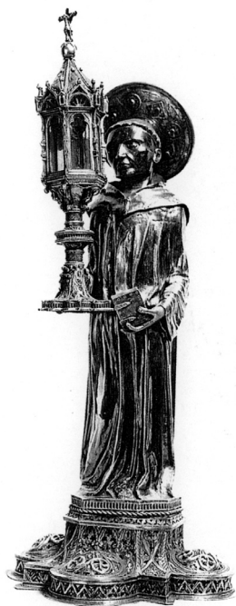
Moćnik prsta sv. Ante Padovanskog, Padova, Basilica del Santo, Tesoro delle reliquie