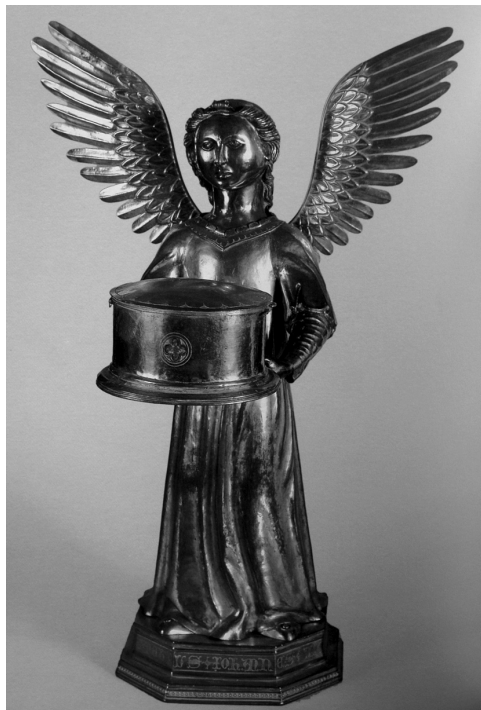
Anđeo s relikvijom sv. Andrije, katedrala u Veltralli (Viterbo)

Iako su dalmatinske crkvene riznice bile pune bogato ukrašenih brahijarija u gesti blagoslivljanja, u dragocjenim rukama nisu nužno bili ti dijelovi tijela. Jedan od sličnih primjera je ruka sv. Donata sa svečevom claviculom iz prve pol. 15. st. koja je pripadala zadarskoj katedrali. 57 Oblik precioznog pokrova u obliku ruke vjernicima je značio blagoslov, ozdravljenje i milost jer je sadržavao dio svečeva tijela.