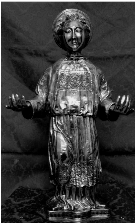
Toma Radoslavić, Figura anđela