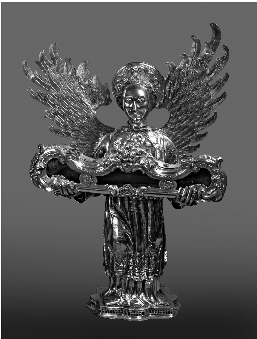
Toma Radoslavić, Srebrni anđeo s relikvijom ruke sv. Ivana Trogirskog, Riznica katedrale sv. Lovre u Trogiru

kružićima aplika se plastično odvaja od tkanine na koju je prišivena. Isti se motiv ponavlja na leđima kao i ispod ramena. Na sredini je romb s upisanim četverolatičnim cvijetom šiljatih latica i mrežasto ukrašenim tučkom. S obje strane romba po jedan je cvijet s pet polukružnih latica, a prazni prostor ispunjen je bogato oblikovanim lišćem. Na donjem je rubu misnice mnogo šira aplika s pet cvjetova i lišćem koje ide u suprotnim smjerovima. Iznad veza se izmjenjuju nabori te je vješto izveden florealni motiv u skraćenju. Na stražnjoj strani ponavlja se motiv