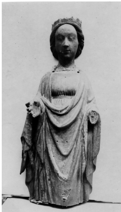
Blaž Jurjev, Lik sv. Katarine

Reljefni središnji lik sv. Katarine, s poliptiha iz crkve trogirskih dominikanaca, svojim hijeratskim stavom, s blago ispruženim rukama, fragilno opuštenim ravnima i ovalnim licem, mogao je utjecati na figuraciju majstora Tome.