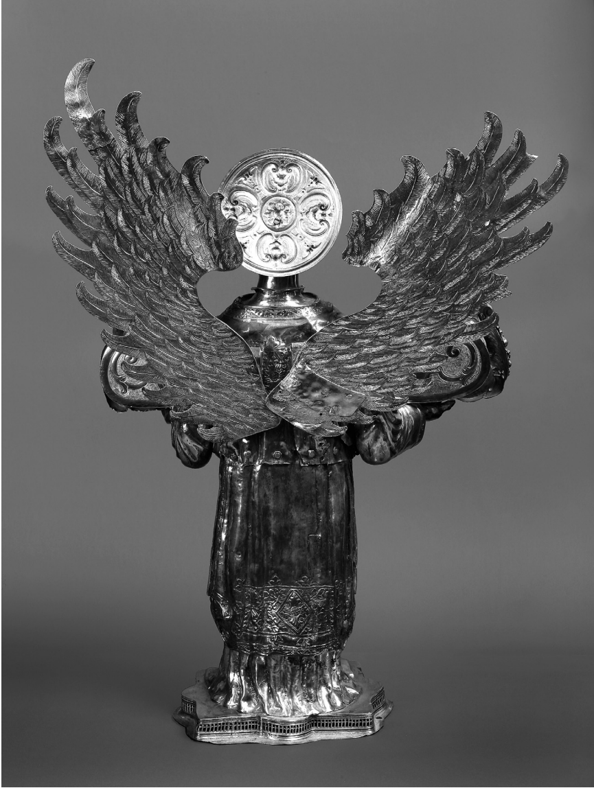
Toma Radoslavić, Leđa srebrnog anđela s krilima

romba sa središnjim cvijetom i četiri lista sa strana, a lateralno se veliki razgranati list usmjerava prema sredini. Rubom dalmatike teče uska traka intermitirajuće lozice koja se penje i po rubu proreza sa strane. Na završetku rukava je šira vrpca s urezanim lišćem i kružićima u pozadini.