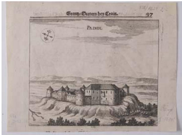
Slika 4. Prindl

Vrsta građe: vizualna građa Naslov: Prindl. Impresum: [Laybach : s.n. ; In Nürnberg : zu finden bey Wolfgang Moritz Endter, ..., 1689.].