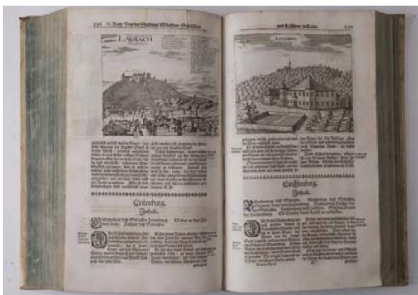
Slika 3. Janez Vajkard Valvasor: Die Ehre dess Hertzogthums Crain