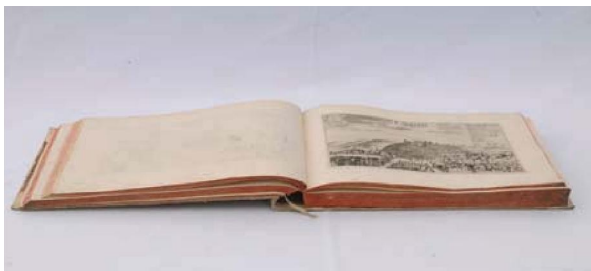
Slika 2. Janez Vajkard Valvasor: Topographia ducatus Carnioliae modernae