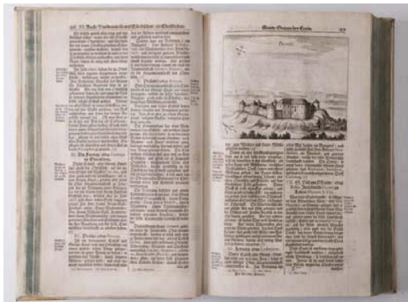
Slika 5. Janez Vajkard Valvasor: Die Ehre dess Hertzogthums Crain

Materijalni opis: 1 grafika : bakropis ; otisak 123 x 148 mm, list 148 x 194 mm. Napomena: Signature nema; s.g. na prikazu otisnuto: PRINDL; l.g. na prikazu otisnut kompas; s.iznad prikaza otisnuto: Grenz Oertern bey Crain.; d.g. iznad prikaza otisnuto: 97; s. ispod prikaza otisnuto: 463 Na poledini grafike otisak; Grafika izrezana iz knjige; Grafika objavljena u: Valvasor, Janez Vajkard. Die Ehre des Hertzogthums Crain..., Laybach : s.n., 1689., Reprodrukija: Izvornik digitaliziran Opis/Sažetak: Prikaz utvrđenog grada Brinja Ključne riječi: *Bakropisi Mjesto izdavanja: Slovenija -- Ljubljana Ostali autori: Valvasor, Janez Vajkard Endter, Wolfgang Moritz ID zapisa: 000679104 Lokacija: Grafička zbirka GZGAN top 401