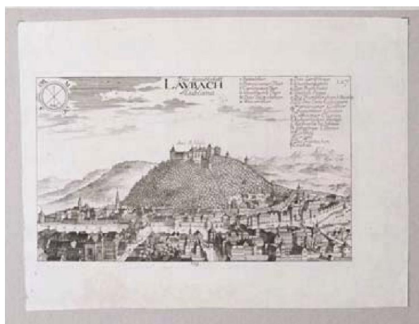
Slika 1. Andreas Trost: Die hauptstatt Laybach = Lublana