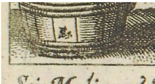
Slika 7. Sebastian Furck: Honora medicum propter necessitatem: Sibintum venetian Detalj s monogramom