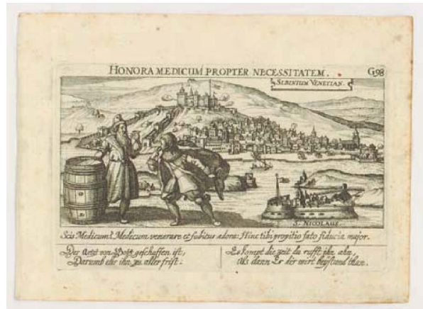
Slika 6. Sebastian Furck: Honora medicum propter necessitatem: Sibintum venetian

Vrsta građe: vizualna građa Autor: Furck, Sebastian Naslov: Honora medicum propter necessitatem : Sibintum venetian / [gravirao] S.[Sebastian] F.[Furck]]. Impresum: [Frankfurt : Daniel Meisner; Eberhard Kieser, 1623-1632]. Materijalni opis: 1 grafika : bakropis ; otisak 96 x 146 mm, list 134 x 172 mm. Napomena: Monogram otisnut l.d. na prikazu: SFf.; iznad prikaza otisnuto: HONORA MEDICUM PROPTER NECESSITATEM G 98 // SIBINTUM VENETIAN; ispod prikaza otisnuto: Scis Medicum? Medicum venerare et fubitus ado-