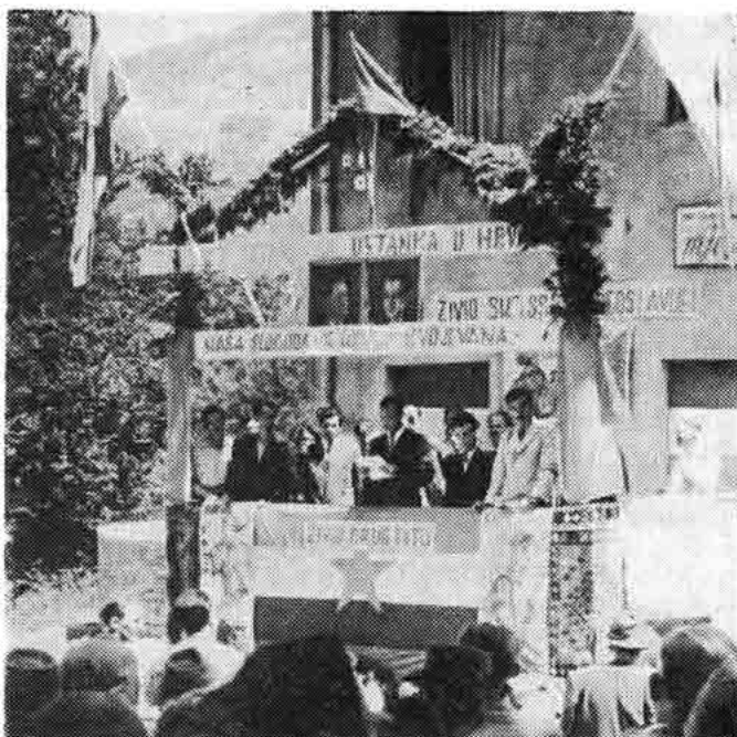
Sl. 50 — Proslava Dana ustanka Hrvatske — narodni zbor u Krivom Putu — kod Odbora, 1950.

Neko vrijeme radio je na dužnosti upravitelja đačkog Doma industrijske škole u Rijeci, a zatim radi kao direktor poduzeća »Duhan«. 15