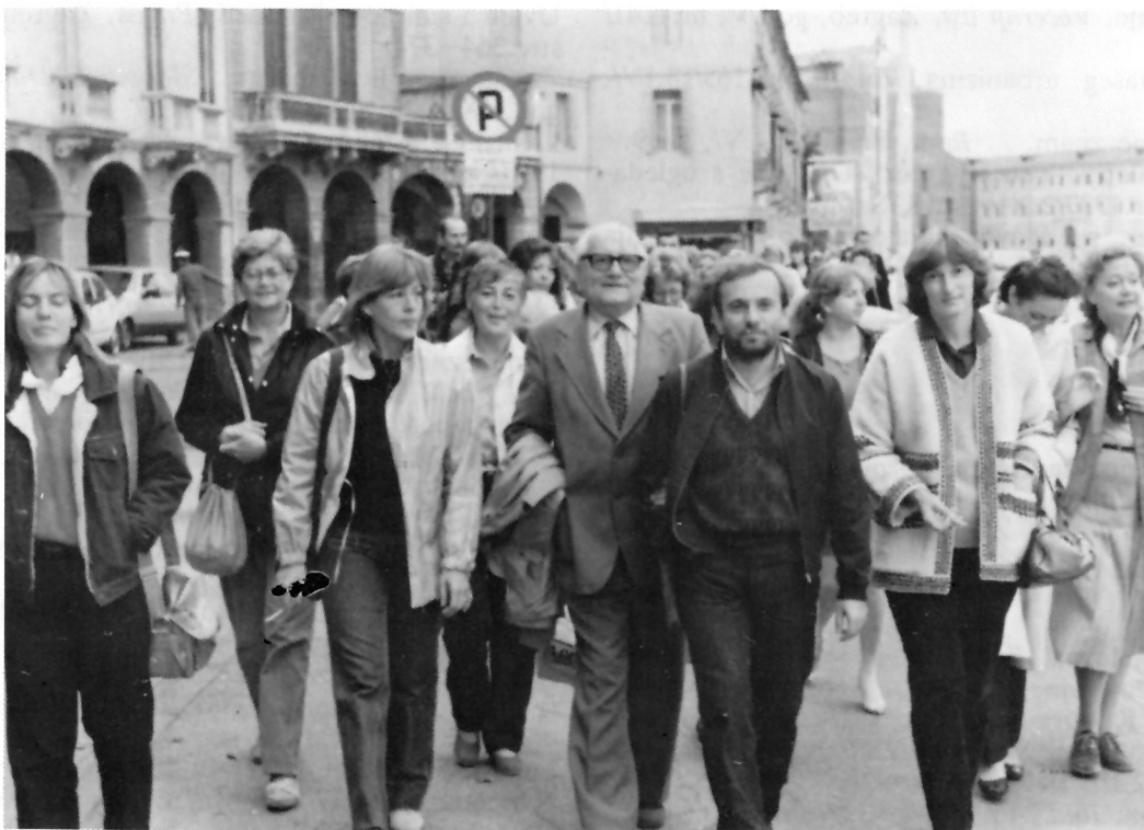
Društvo povjesničara umjetnosti umjetnosti Hrvatske na stručnom putovanju, Padova 1983.

Antikonformizam svakidašnjice, Naše teme , Zagreb, god.VI, br.3/39/, str.420-436.