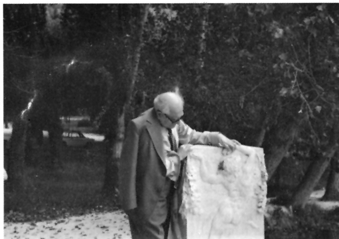
U Fonte di Clitunno, 1983.

Slikari Dubrovnika, Dubrovnik , god.II, br.2-3, str.132-133.