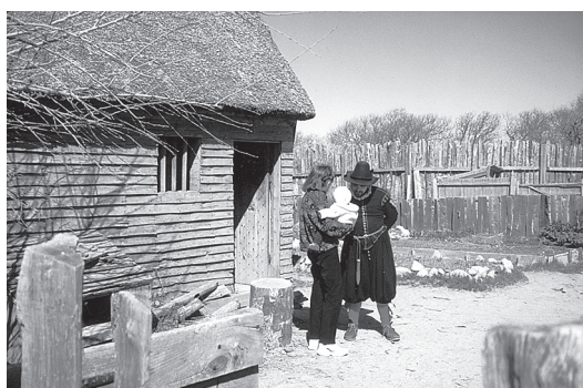
sl. 5. Rekonstrukcija naselja Plymouth Plantation