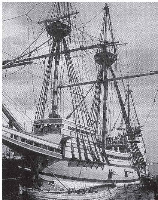
sl. 2. Mayflower II . usidren u luci Plymouth

Projekt za gradnju izradio je brodski arhitekt William A. Baker s MIT-a (Massachusetts Institute of Technology), a gradnja je bila dogovorena s brodogradilištem Upham iz Brixhama, Devonshire, Engleska. Nije se štedjelo ni na čemu kako bi replika bila što vjernija originalu. Bilo je pažljivo izabrano drvo devonskog hrasta, rukom šivana lanena jedra, konopci od konoplje, rukom kovani čavli, katran iz Švedske kakav se upotrebljavao u 17. st. Svi materijali i način izrade detalja izvedeni su na osnovi istraživanja brodske i kućnog inventara ranog 17. st. Tako se u kapetanskoj kabini mogu vidjeti stari navigacijski instrumenti, rukom izrađene brodske svjetiljke od drva i kosti, rukom izrezbarena kutija za zemljopisne karte (i ovdje rukom obojene) od hrastovine, s monogramom C. J., kapetana Mayflowera 1620. g. Boje broda proučavale su se sa starih nizozemskih i engleskih slika tadašnjih trgovačkih brodova, pa je trup broda bio u boji