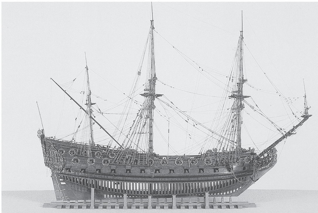
sl. 8. Maketa broda HMS Grafton iz 1679. g. nalazi se u Gallery of Ships u Naval Academy Museum, koja je u sastavu Pomorske akademije u Annapolisu

da je izgrađeno 1627. g. jer se iz te godine sačuvao dokument s popisom tadašnjih stanovnika, odraslih muškaraca, udanih žena, djevojaka i djece. Sastavljen je radi podjele stoke koja je do tada bila zajednička, a te je godine podijeljena, i to tako da je svakih 13 odraslih osoba dobilo po jednu kravu i dvije koze.