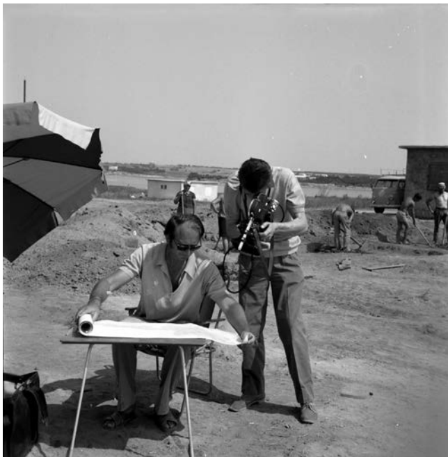
Slika 4. Nin - Ždrijac. Snimanje priloga za Radioteleviziju Zagreb 1971

Figure 4. Nin-Ždrijac. Recording the spot for Zagreb Radio & Television in 1971