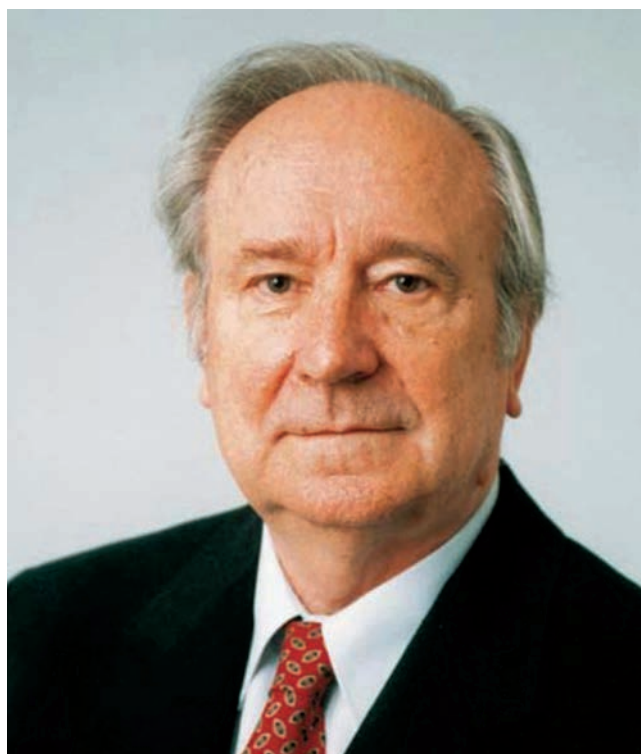
Slika 10. Dr. sc. Janko Belošević, profesor emeritus

Primjerice 1965. u tadašnjem Radničkom sveučilištu u Biogradu izlagao je o povijesti toga grada, a 1967. je na Filozofskom fakultetu u Zagrebu govorio o rezultatima svojih istraživanja u dolini Trebišnjice, dok je u Podružnici muzealaca u Zadru, iste godine, održao predavanje s naslovom „ Problemi Istočnih Gota na tlu Dalmacije u svjetlu arheoloških nalaza “. U Pododboru Matice hrvatske u Zadru (1969.) izlagao je o rezultatima hrvatske arheologije poslije rata na području sjeverne Dalmacije, dok je povodom osnivanja Ogranka Matice hrvatske u Ninu 1971. predavao o značenju Nina za hrvatsku arheologiju. Iste godine je u Podružnici Povijesnog društva Hrvatske u Zadru govorio o najznačajnijim arheološkim rezultatima na polju hrvatske