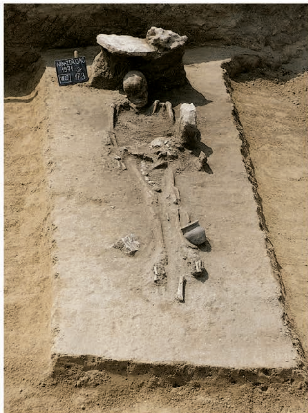
Slika 6. Nin - Ždrijac. Istraženi starohrvatski grobovi Figure 6. Nin-Ždrijac. Investigated Croatian graves