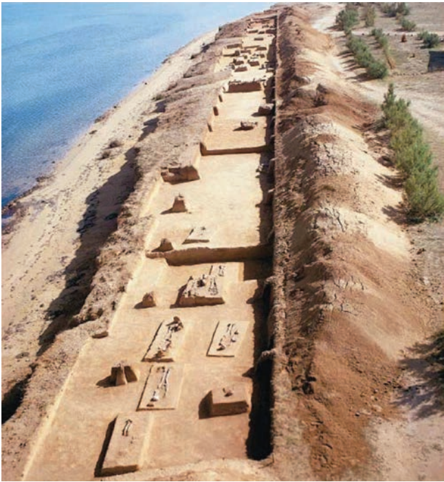
Slika 5. Nin - Ždrijac, istraženi dio ranohrvatskoga groblja Figure 5. Nin-Ždrijac, investigated section of the early Croatian cemetery