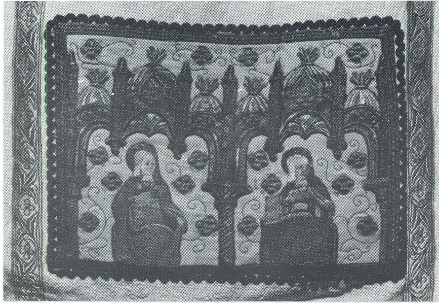
Korčula, Fragment misnice, Opatska zbirka