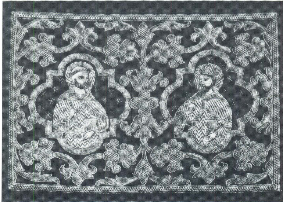
Korčula, Fragment misnice, Opatska zbirka