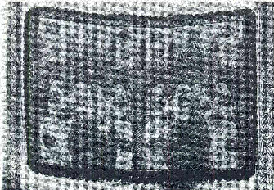
Korčula, Fragment misnice, Opatska zbirka