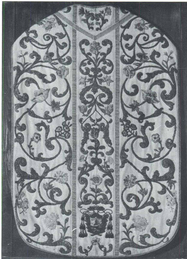
Korčula, Misnica, Opatska zbirka

isplaćuje 1693. godine za antependij, plašt i mitru dio ugovorenog novca, a 1698. godine izvještava o trošku od 2.423,6 lira za cijeli komplet, što je