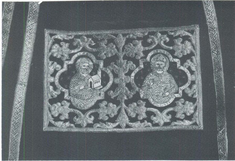
Korčula, Fragment misnice, Opatska zbirka