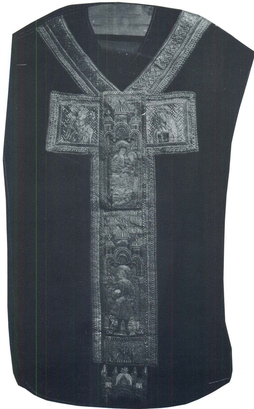
Korčula, Misnica, Opatska zbirka