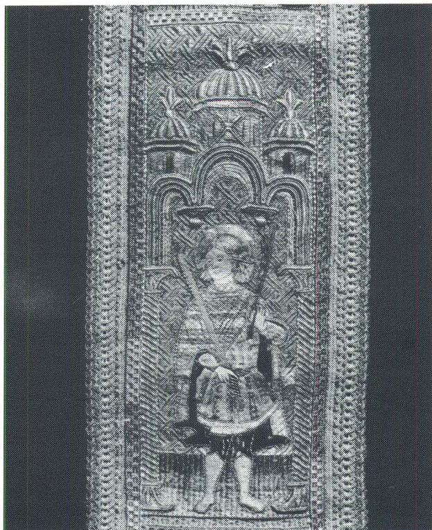
Korčula, Fragment misnice, Opatska zbirka

Osim ovdje prikazanog ruha izloženog u Opatskoj riznici, u sakristiji korčulanske stolnice pohranjen je veći broj misnica, dalmatika i ostalog dobavljenog u 19. stoljeću. 32 To je razdoblje nakon ukinuća biskupije i općeg osiromašenja grada, pa je većina predmeta skromne industrijske proizvodnje, bez veziva i bogatijeg ukrasa.