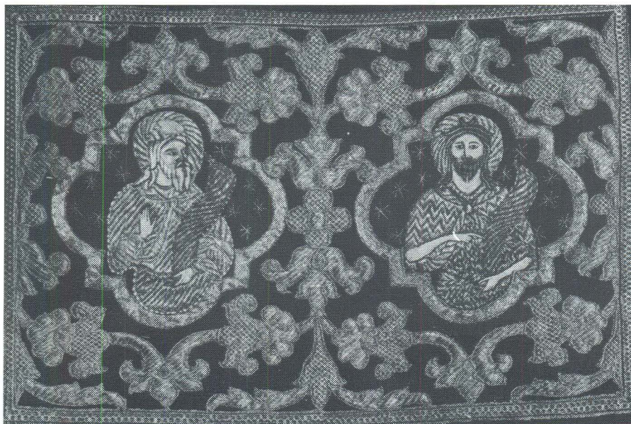
Korčula, Fragment misnice, Opatska zbirka

Dalmatike (dvije) koje su popravljene istovremeno, ukrašene su s po četiri pravokutna, bogato vezena medaljona s viticama, cvijećem i likovima svetaca. Izrada veziva, a naročito crtež likova drugačiji su od onog na misnici pa očito ne pripadaju istoj cjelini (premda su joj u naše