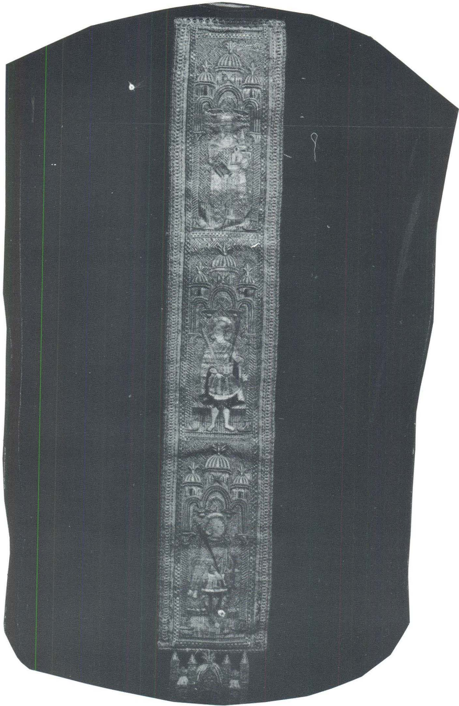
Korčula, Misnica, Opatska zbirka