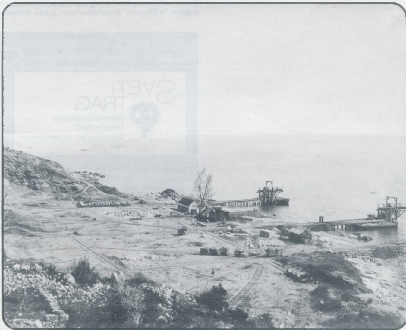
Prostaniste Preluka, Rijeka, oko 1880. godine