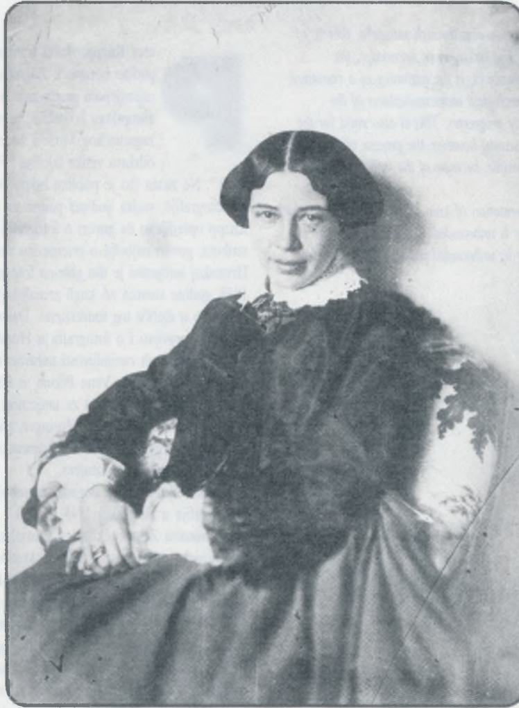
J. Drašković, Portret mlade djevojke, Trakošćan, 1850-ih Iz Zbirke fotografija Muzeja za umjetnost i obrt u Zagrebu

Sve ovo što govorim zapravo je afirmacija jedne solidne izložbe kojom se