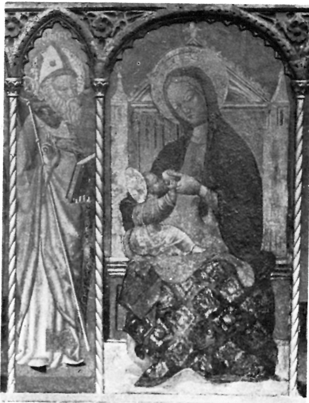
5 Poliptih Gospe kraj mora na Ciovu