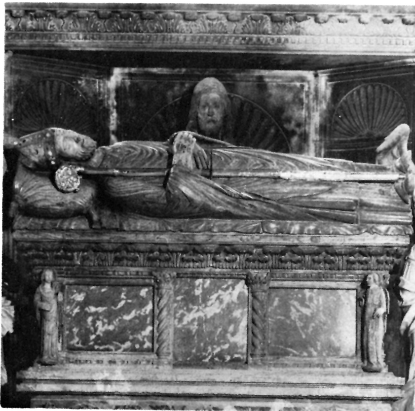
1 De Sanctisovi, Sarkofag — svečeva kapela u stolnoj crkvi

Godine 1308. dan je oprost na blagdan 14. studenoga i sigurni je znak štovanja svetoga Ivana iako to nije u ispravi spomenuto. Godine 1322. štovanje se određuje gradskim statutom, a deset godina nakon toga stavljen je pečat sa svečevim likom u vratima grada i repaticom iznad zidina i zvonika na mirovni ugovor sa susjednim Šibenikom. U to vrijeme zabilježeno je i svečano zaklinjanje na svečeve moći kao znak pridržavanja ugovora. Od 1331. do 1348. građena je u sjevernoj apsidi stolne crkve raskošna kapela svecu u čast, i u novi sarkofag u toj kapeli prenesene su moći 20. lipnja 1348. iz južne apside gdje su stajale na oltaru svetih vrača Kuzme i Damjana. Tada započinje i širenje štovanja izvan grada, a najstariji mu je spomen u gradnji crkvice na rtu Ploča, pred kojim je Ivan, kako priča stari životopis, brodeći za Šibenik doživio brodolom iz kojeg se spasio hodajući po moru i na taj vjetrom bijeni kamen što se pružio u more, i još uvijek prijeti mornarima, izveo brodolomce, a iz mora je na njegovu zapovijed izišla lađa čitava, tako da ni jedna kaplja vina što su ga prevozili nije uzmanjkala.