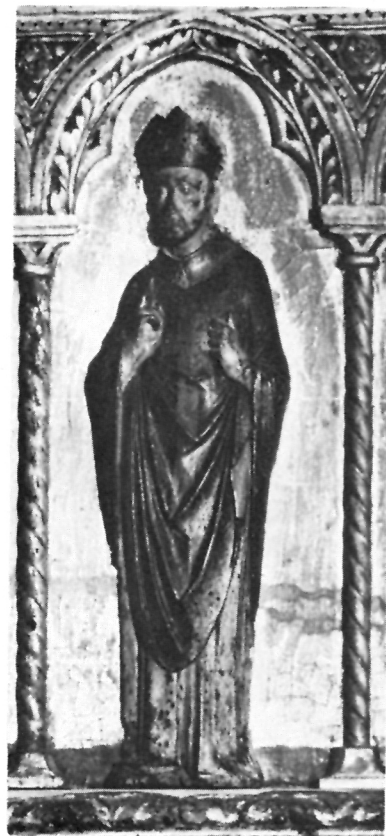
6 Martin Petković, Poliptih benediktinki Sv. Dujma (Nikole)