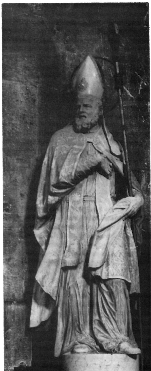
10 Kip s glavnog oltara stolne crkve