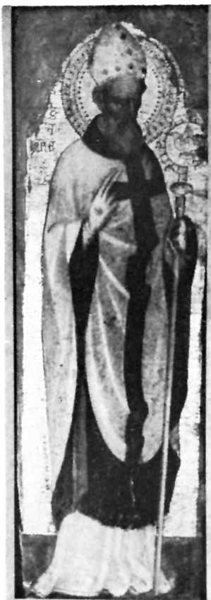
2 Dominikanski poliptih