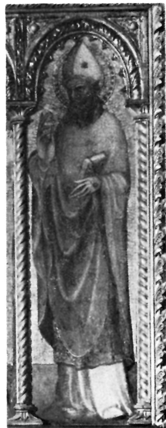
4 Poliptih stolne crkve

a vino prestaje teći tek kada sluge pokažu malodušnost. Hodanje po moru, iako najsličnije prizoru Kristova čuda, smješteno je na olujno more kod rta Ploča, a biskup spašava lađu punu vina kojom je plovio u Šibenik. Golubica ne šapće biskupu mudrost Duha kao papi Grguru, već samo stoji kao znak da je svetac onaj čovjek koji je kralja nagovarao na mir sa Zadranima. Ta slika golubice iznad glave misnika mogla je vjerojatno biti uzeta iz stvarnosti, jer je Svetotajstvo čuvano u spremištu koje je u obliku golubice visjelo iznad oltara.