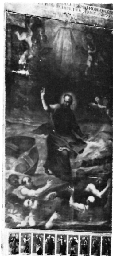
12 Čudo brodoloma — sjeverni stub u stolnoj crkvi

ovoga sveca niti bilo kakav likovni prikaz posredno ili neposredno vezan s Ivanom.