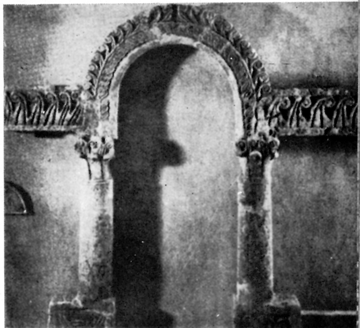
Sl. 1. Lundo, zabat crkvene pregrade (oko 800. g.)