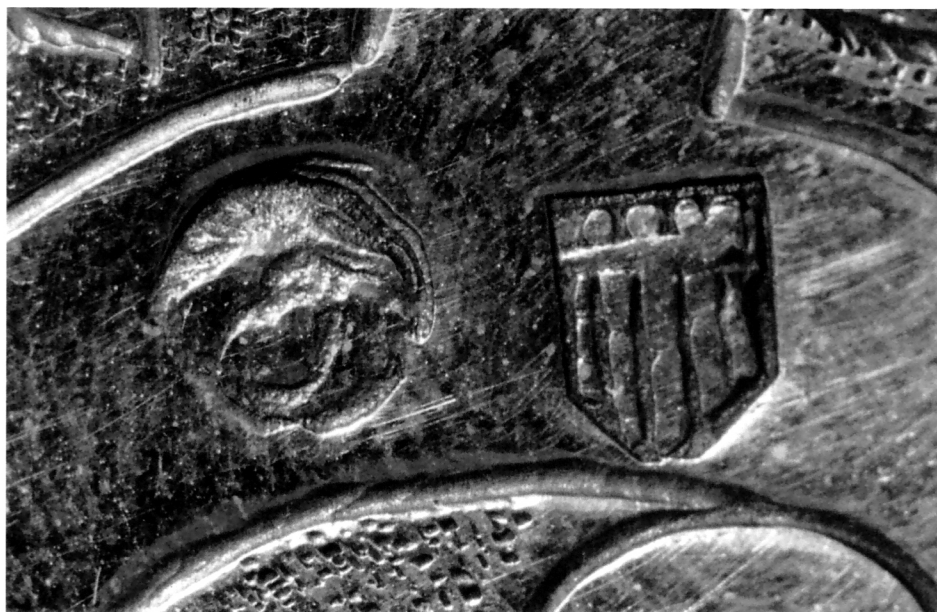
Državni žig Mletačke Republike i radionički žig "Scudo" na ophodnom raspelu

Ophodno raspelo iz župne crkve sv. Nikole u Perastu (v. 103 cm, a v. figura sv. Ivana i Bogorodice 13,2 cm), za razliku od dubrovačkog primjera, koji s prednje strane ima kao jasno profiliranu želju naručitelja (franjevačkog reda) niz franjevačkih svetaca, u hastama križa ima četiri crkvena naučitelja: sv. Jeronima, sv. Augustina, sv. Grgura i sv. Ambrozija. Peraško raspelo poput dubrovačkoga na stražnjoj strani ima likove evanđelista. Dubrovačko raspelo ima sa stražnje strane likove crkvenih naučitelja bliske figuracije onima s prednje strane peraškog raspela. Kristov korpus na peraškom križu bliske je forme dubrovačkom primjeru, otklonjene glave nadesno i povijenih nogu. U tradiciji još gotičkih raspela, a ovdje za razliku od dubrovačkoga Krist je pribijen na iskucani križ na pozadini. U osnovi iskazivanja manirističke prenatlaženosti dubrovačko ophodno raspelo prednjači jer se stvara ugođaj da je osnovno tijelo križa obavijeno srebrnom čipkom nosača vrpce, dok je na peraškom primjeru vidljiva čvršća kompozicija i originalno riješen nodus s visokim reljefom putta, između kojih se nalazi dopojasni lik Kristov – Ecce Homo. Na peraškom su raspelu u tradicionalnoj formi raspela-Kalvarija pridodani likovi sv. Ivana i Bogorodice na samostalnom nosaču iznad složenog figurativno bogatog nodusa raspela.