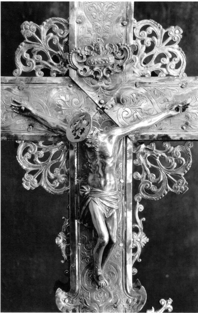
Kristov korpus s križišta ophodnog raspela