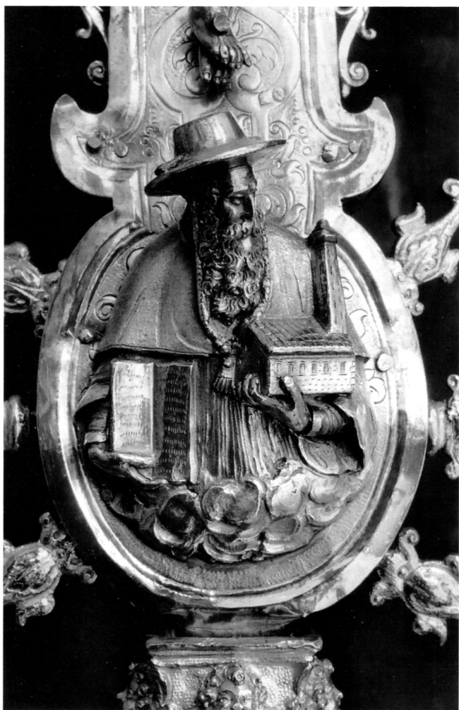
Srebrni reljef sv. Jeronima