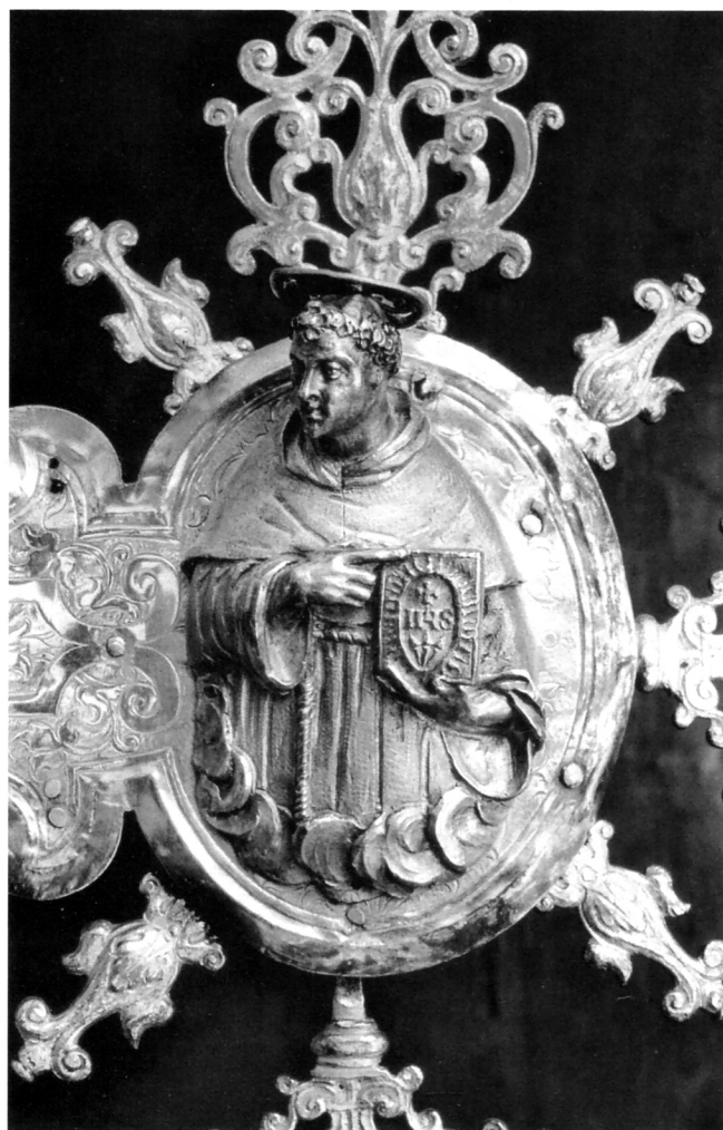
Srebrni reljef sv. Bernardina Sijenskog

(Grada) i Milja (Muggie), potvrđuju visoku umjetničku razinu tog umjetničkog obrta. 7 Od svih mletačkih kipara sitne kovinske plastike Tiziano Aspetti ml. i u je ovom konzervativnom obliku umjetničkih predmeta pokazao najveći otklon prema toskanskoj renesansi, s dozom mletačke gracioznosti, a to potvrđuje inventivnost u odnosu prema klasičnim mletačkim zlatarima Daneseu Cattanei i Giacomu de'Grandiji.