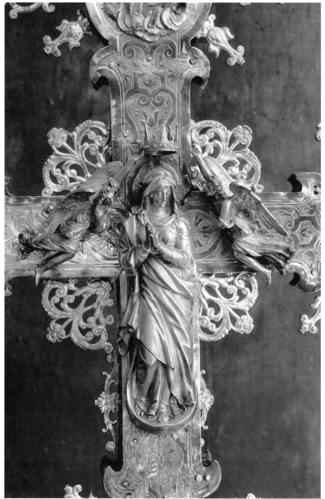
Krunjenje Bogorodice na križištu reversa ophodnog raspela

stoljeća, kako izvješćuje njegov suvremenik povjesničar Antun Matijašević Karamaneo u pismu upućenom don Jakovu Salečiću iz Smokvice. Viški kipići nisu dakle bili in situ , već su poput onih iz Smokvice pričvršćeni na svetojstaništu crkve u Prigaliji. Po svemu sudeći, dva klerika, korčulanski i viški, podijelili su set brončanih figurica erosa-angelčića, koje su mogli nabaviti u Mlecima, ili u Rimu, tijekom boravka ad limine . 4