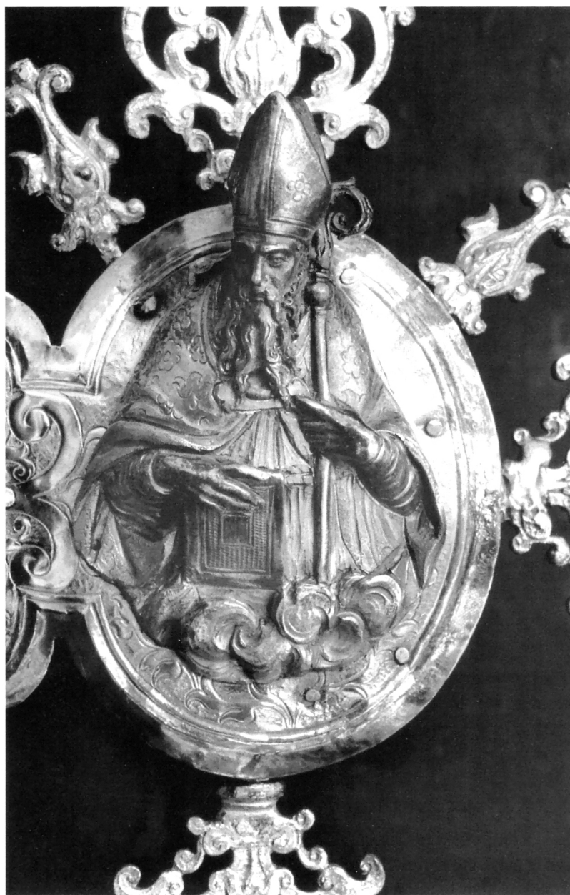
Srebrni reljef crkvenog naučitelja (sv. Ambroz ili sv. Augustin)

noj vrsnoći ovog primjera sitne kovinske kasnorenesansne plastike.