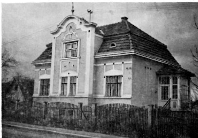
100. M. Popović, Vila Mira, 1905.

To su vrijednosti u graditeljstvu Siska koje podvlači Ivo Maroević, naglašavajući trenutak kada je se-