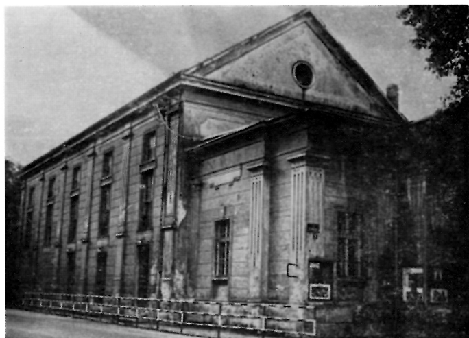
103. Zgrada kina Sloboda, 1901—1903.

Određeni tip dekoracije u jednom trenutku gotovo u cijeloj Evropi prepoznamo kao secesijski. To je opći stilski kontekst. Drugo, što je važno istaći, i što prati kao bitno svu izgradnju sa secesijskim obilježjem, odnos je umjetnika i obrtnika. Znamo da su u to vrijeme takva udruženja brojna i da su se neka dugo održala (Bečka radionica umjetničkih obrtnika 1903—32). Pomasovljivanje i industrijalizacija proizvodnje, te naglašavanje dekorativnosti ubrzo su dovele do razdvajanja: s jedne strane, ostaju obrtnici gubeći raniju razinu kakvoće i s druge, umjetnici prenaplašene osjećajnosti i esteticizma. Proizvodnja obrtnika također bi trebala biti predmet povijesti umjetnosti i izvan konteksta dizajna, barem u tipološko-vremensko-stilskim određenjima, bez obzira na pad vrijednosti ili razne devijacije. Drugo, tautologija do koje je stigla proizvodnja pravih umjetnika dovela je do brzog i gotovo istovremenog iščeznuća secesije u zapadnoj Evropi, a time i odredila vremensku granicu trajanja secesije u kronološkom zbivanju umjetničkog života. Mislim da