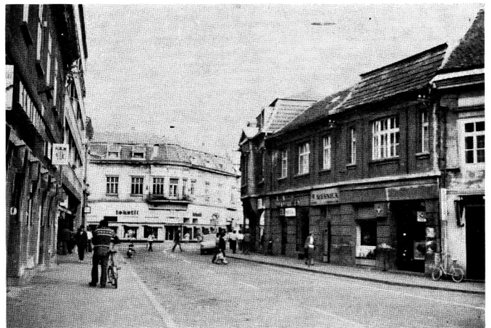
105. Interpretacijske i urbane vrijednosti, Sisak, oko 1920.

Pogledamo li hrvatske gradove, koje bi mogli nazvati secesijskim? U užem izboru ostali bi Osijek od većih i Sisak. Tu broj zgrada nije odlučujući, već činjenica da je secesija dovršila ono što nazivamo sisačko graditeljstvo (Maroević). Secesija je ograđanstvena Sisak. Kad govorimo o Sisku, gradu u arhitektonsko-urbanom smislu, uvijek je to slika o klasicističkom Fistrovićevom planu i secesiji koja je dovršila sisački ambijent. To su dva najvažnija graditeljska sloja grada Siska. Posebno je važno da se kuće sa secesijskim oznakama, ili one stilski kompaktnije, nisu secesionirale u urbanom tkivu, već su interpolaciju shvatile kao vlastiti uvjet. I to su važne arhitektonske situacije naše secesije. Primjer takve kvalitetne interpolacije čine Strieglova kuća i zgrada Trgovačkog doma, ugao Kranjčevićeve i Ulice m. Tita, zgrade koje gotovo magijski