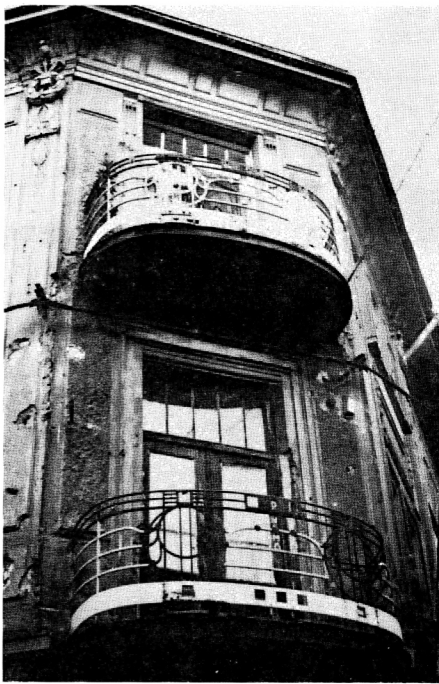
106. M. Popović, Kovana balkonska ograda, oko 1914.

Također valja istaći i industrijsku gradnju koja nosi karakteristike secesije: bivšu Šeširku, sada Tvornicu plastičnih masa, te kompletni plan tvornice Teslić , sada Segestica , od koje je dio izveden. Vrlo su važna rješenja Jodnog kupatila (1925), koja svjedoče o stanjanju secesijske gradnje s novim rješenjima. Samo funkcija zgrade omogućila je zadržavanje običaja dekoriranja keramičkim pločicama u interijeru.