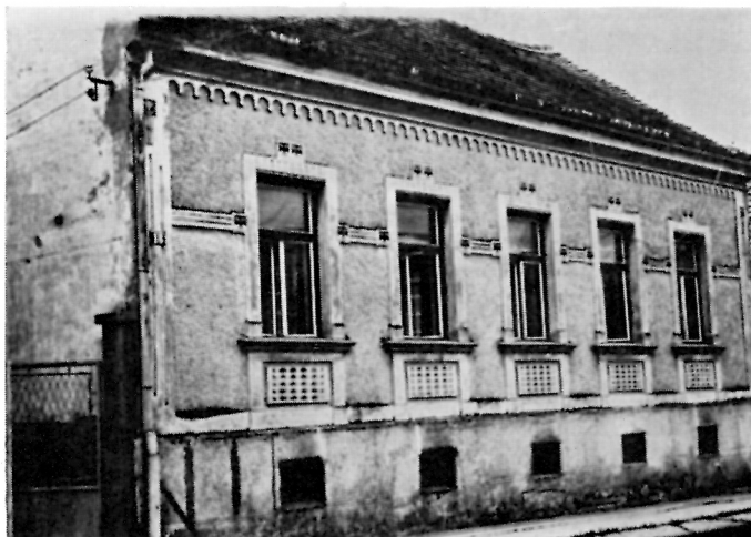
101. Pučka izgradnja između 1910 i 1920.

Međutim, dugo trajanje i prisutnost secesije probudila je potrebu sagledavanja njene sudbine daleko od evropskih središta, tamo gdje se neposredno dotičala s drugim svjetovima , gdje je egzistirala više malograđanski nego elitno, gdje je ušla u selo, društveno još neprobuđenu snagu. Dapače, trebalo bi proučiti i samu seosku radinost i razlučiti npr. karakterističnu secesijsku floru u cvjetnim motivima veza na ženskoj nošnji Sisačke Posavine, ili npr. odrediti podudarnost boja, koje bi odgovarale secesijskom koloritu (svjetloplava, roza, lila itd.) sa suvremenim prijelazom s domaćeg konca na industrijski ili na svilu.