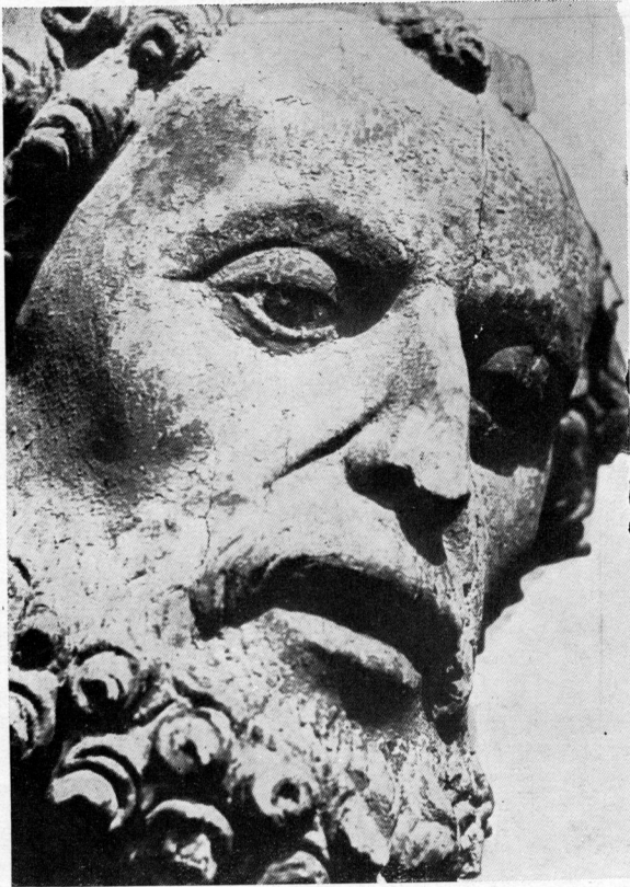
1. — Glava apostola Petra