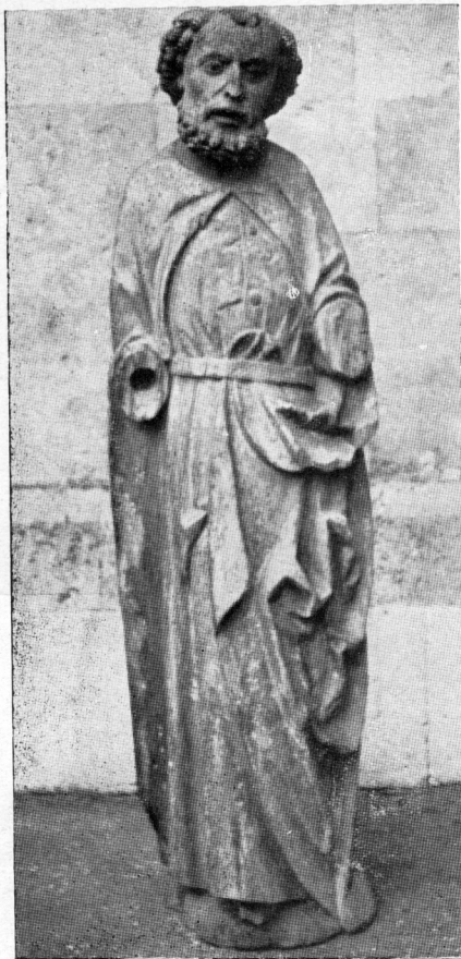
3. — gotički kip apostola Pavla (konac XU. st.)