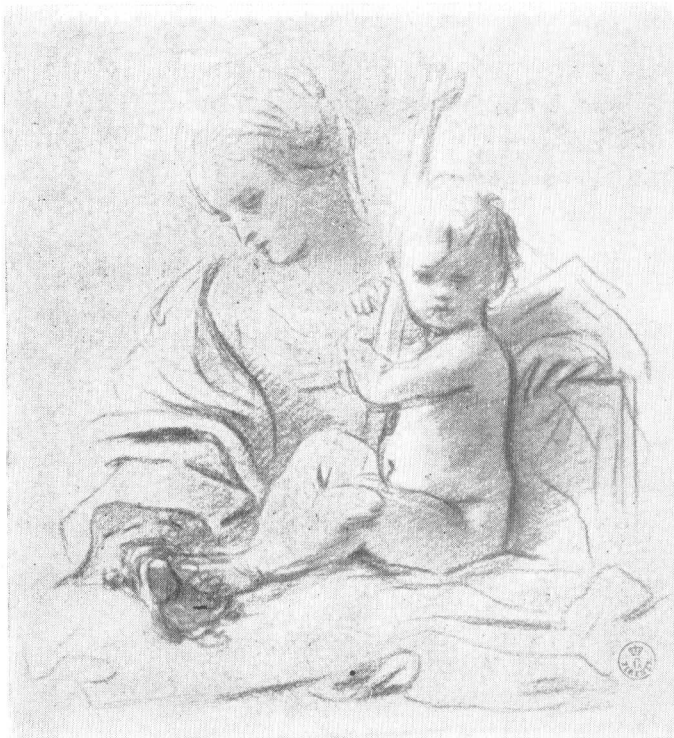
Sl. 3. B. Schedoni, Sv. obitelj , crtež — Uffizi, Firenza