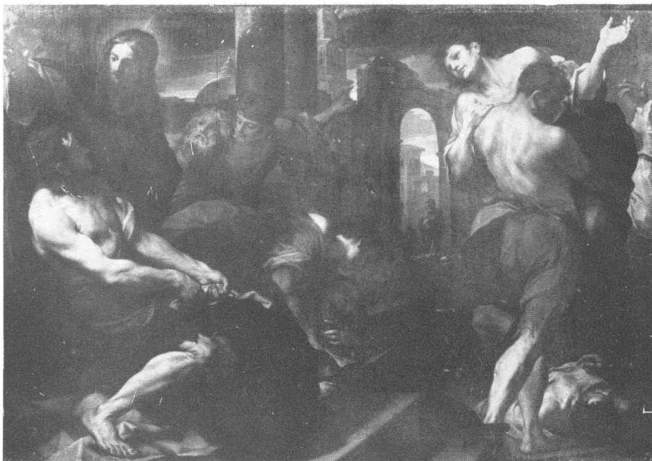
Sl. 10. D. M. Viani , Čudotvorna kupelj — Privatna zbirka, Piacenza