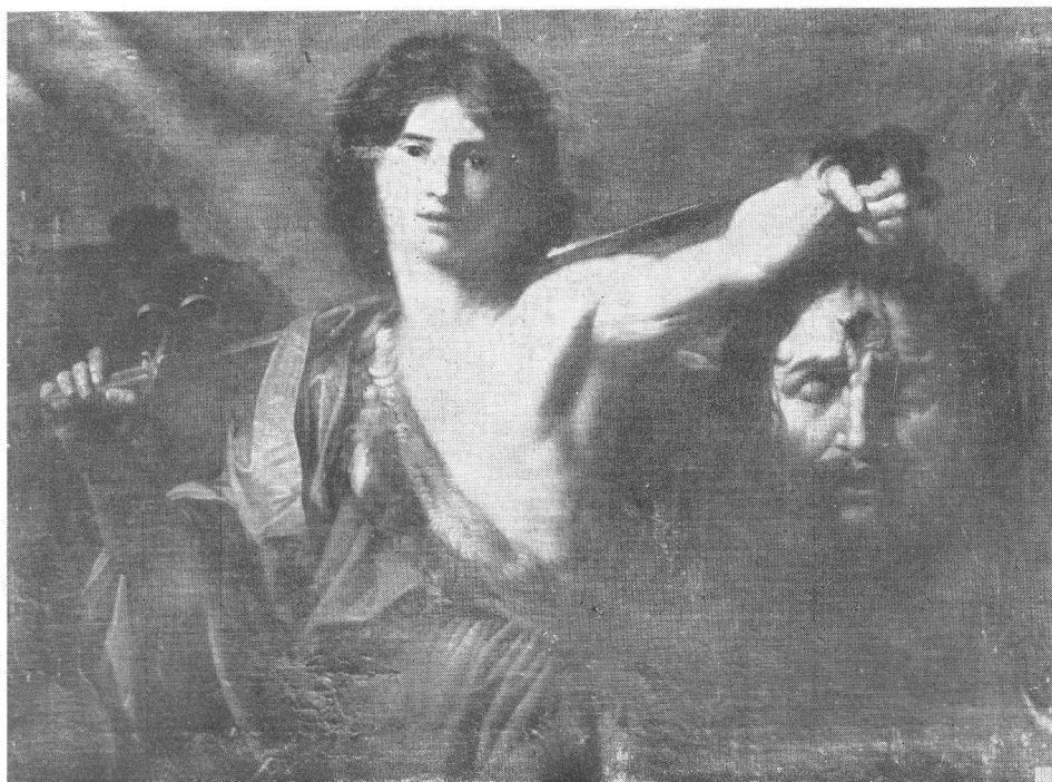
S. 7. Il Guercino, David — Narodni Muzej, Beograd