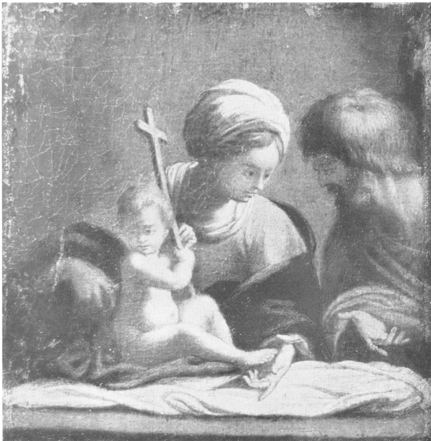
Sl. 1. B. Schedoni, Sv. obitelj — Strossmayerova galerija, Zagreb

Budući da nije vjerojatno da bi sam majstor izradio repliku svoje vlastite slike u obratnom smislu, moralo bi se prihvatiti mišljenje da je prema Schedonijevu bakrotisku netko drugi kasnije izradio kopiju. No stvar se može shvatiti i drugačije: da je slikar izradio skicu za bakropis, izveo ga u obratnom smjeru, a istovremeno i sliku. Bilo bi sasvim razumljivo da slikar od kojega je sačuvan samo jedan bakropis, što pokazuje da se očito nije time bavio, nije htio svoju invenciju ostaviti neiskorištenu, nego je uz bakropis izradio i sliku. Međutim, fina izvedba s tankim namazima na zagrebačkoj slici ne čini mi se da potječe od samog Schedonija. Bar meni nije unutar njegove evolucije poznata. To su