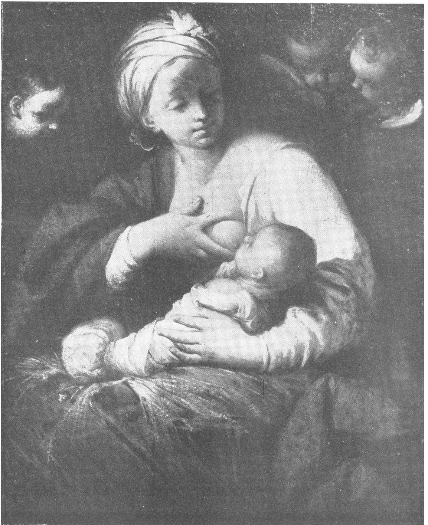
Sl. 4. Simone Cantarini, il Pesarese, Madona s djetetom — Strossmayerova galerija, Zagreb