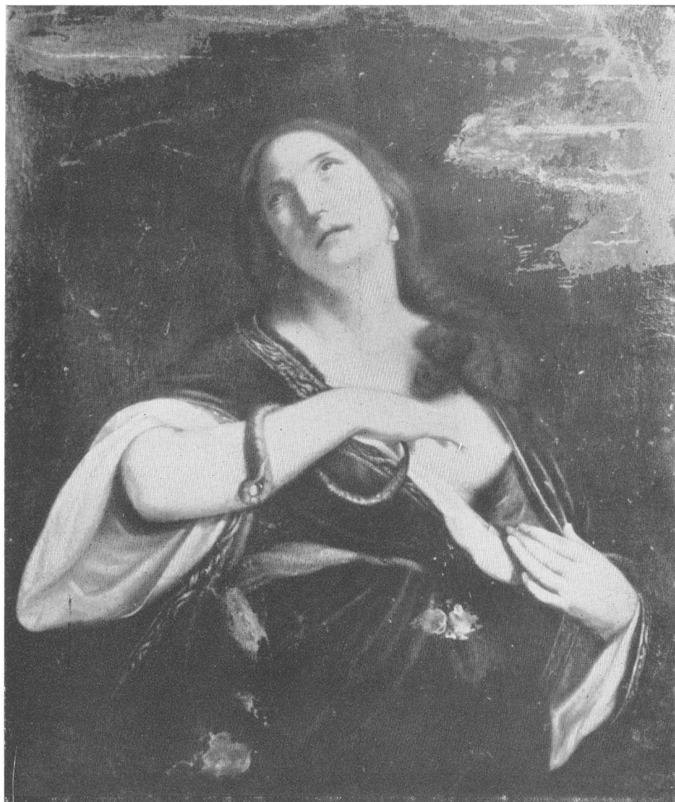
Sl. 6. Guido Cagnacci, Smrt Kleopatre, — Muzeum Narodowe, Warszawa

moderna predilekcija za piktoralnu slobodu i psihološku fantastiku (od G. M. Crespia do Magnasca) već potisnula u pozadinu; ali da i unutar tog oficijelnog lica baroka još ima kompleksa koji čekaju otkrića i rekuperaciju pokazuje još jednom i slučaj Domenica Marije Vianija.