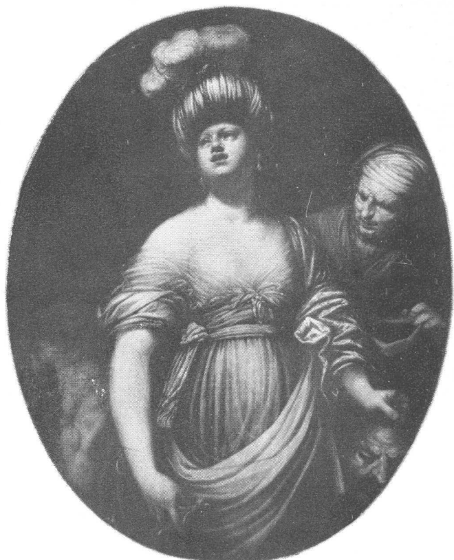
Sl. 5. Masteletta, Judita — Narodna galerija, Ljubljana