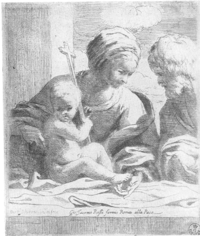
Sl. 2. B. Schedoni, Sv. obitelj , bakropis — Uffizi, Firenza