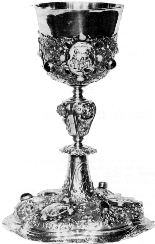
1 Zaccharias Faylla, KALEŽ (1702. g.) — Osijek, župna crkva