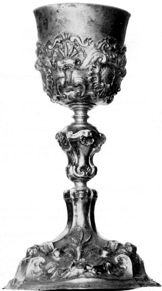
3 Johann Kössler , KALEŽ (1771. g.) — Osijek, Župna crkva

visina 25 cm, promjer baze 15,8 cm, promjer kupe 8,7 cm. Srebrni pozlaćeni kalež veoma sličan po kakvoći