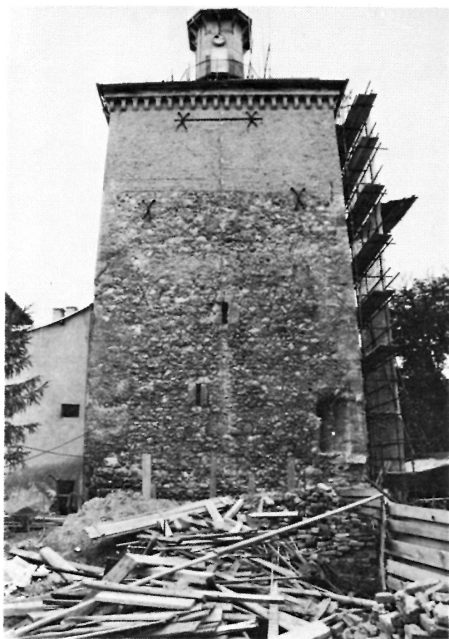
Kula Lotrščak, pogled na zapadno pročelje prije rušenja aneksa

Kao konzultant odazvao se Zorislav Horvat, koji je na temelju postojećih ostataka i analognih do danas sačuvanih sličnih romaničko-gotičkih otvora, pomogao u rekonstrukciju tamo gdje je to bilo potrebno.