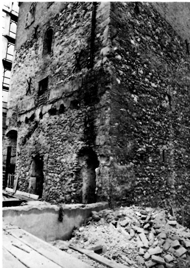
Kula Lotrščak, sjeverni ugao

Komparirajući uvjete dozvole i izvedeno može se utvrditi da je protivno rješenju prethodne dozvole izvedeno: prežbukavanje preostalih autentičnih kamenih okvira strijelnica, zamjena svih izvornih sačuvanih kamenih elemenata portala i prozora, oblikovanje, obrada i način postave kamenih okvira restituiranih prozora i portala, pri čemu se nije izvršio konzervatorsko-restauratorski postupak utvrđivanja i snimanja originalnih fragmenata uz mogućnost zadržavanja i konzerviranja sačuvanih, te njihove dopune adekvatnim prirodnim ili umjetnim kamenom. U unutrašnjosti izvedba neopravdanog kamenog nadvoja prolaza na bedemu, predimenzioniranje kamenog bloka sjedala u prozorskim nišama, prezentiranje izlaza zidnog stubišta u II. kat kule, ulazni podest u prizemlju Vranicanijeve 1 i konačno pročeljna obrada u rekonstrukciji i prezentaciji gotičkog sloja kule (način žbukanja, oblikovanje portala i prozora, te postava kon-