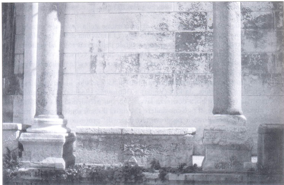
Jugozapadni zid oktogona splitske katedrale

In conformità a molte caratteristiche comuni che collegano il disegno della nave a vela nella cattedrale di Split con altre raffigurazioni delle navi medievali, con l'accento all'immediatezza dell'atto votivo che rivela la religiosità popolare medievale, si può stimare anche il tempo della sua nascita, vale a dire tardo Medio Evo, probabilmente prima del 16° secolo. Per quello che riguarda la nave incisa, è possibile riconoscere un veliero con un albero, menzionato già nei legati notarili dall'archivio spalatino e dagli archivi di altri comuni medievali dal 14° e 15° secolo.