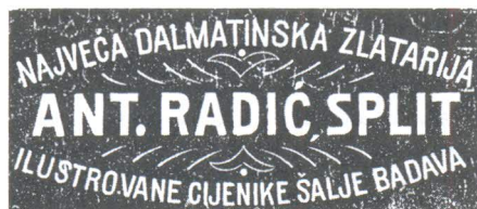
Reklama u listu "Sloboda" Split, 1. siječnja 1913.

Dana 21. ožujka 1914. Franjo Josip I. primio je u Schönbrunn u Beču profesora Josipa Modrića, šurjaka Josipa Botte, koji mu je prikazao ostenzorij. Car je dugo razgledao umjetninu i vrlo se pohvalno izrazio o njoj. Zatim je 28. ožujka Modrić pozvan na prima-