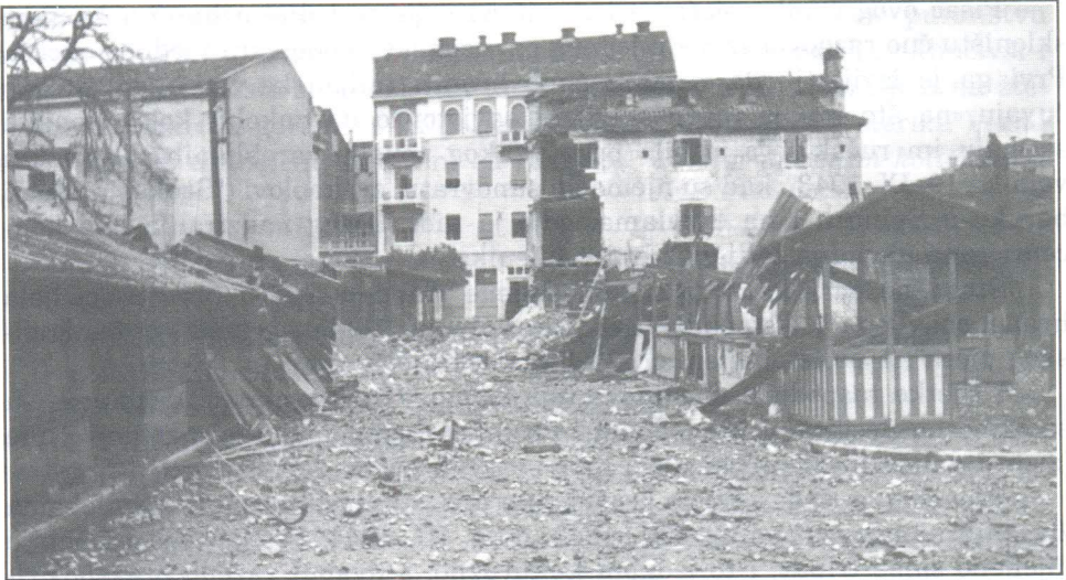
Splitski Pazar poslije bombardiranja Lučca 5. prosinca 1943.. godine. Tog dana je teško oštećena i manja dvokatnica nasuprot kuće Rismondo, pa je poslije rata porušena.

1943. otpočelo rušenje zidanih ostataka nekadašnjeg lazareta, koji je kao zloglasni zatvor sv. Roka bio zapaljen 25. rujna 1943., započelo je zatrpavanje jame otpadnim materijalom od rušenja. 10) Međutim, taj u Hrvojevu ulicu premješteni pazar je u jutarnjim satima 3. lipnja 1944. u prvom i drugom naletu angloameričkih bombardera bio mjesto masakra više od stotinu Splitskana i izbjeglica sa Šolte, Drvenika i iz Stobreča (koje je njemačka vojska nasilno evakuirala koncem travnja), koji su se tu zatekli.