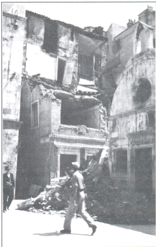
U najžešćem bombardiranju gotovo svih dijelova Splita 3. lipnja 1944. sjeveroistočno od Peristila Dioklecijanove palače porušena je stambeno-poslovna trokatna zgrada Aglič-Mrkonjić. (Snimak je načinjen nedugo nakon toga jer ruševni materijal još posve ispunja uličicu između te kuće i renesansne crkvice sv. Roka.

Pred sam rat, 16. veljače 1941. godine, na tadašnjoj je sjeveroistočnoj periferiji Splita, iza Gripa, u Radničkoj ulici, bila otvorena (prva faza) nove