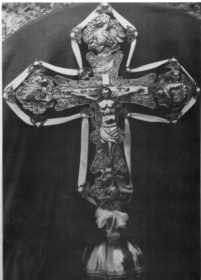
Ophodno raspelo, XV. st, Žrnovo o. Korčula