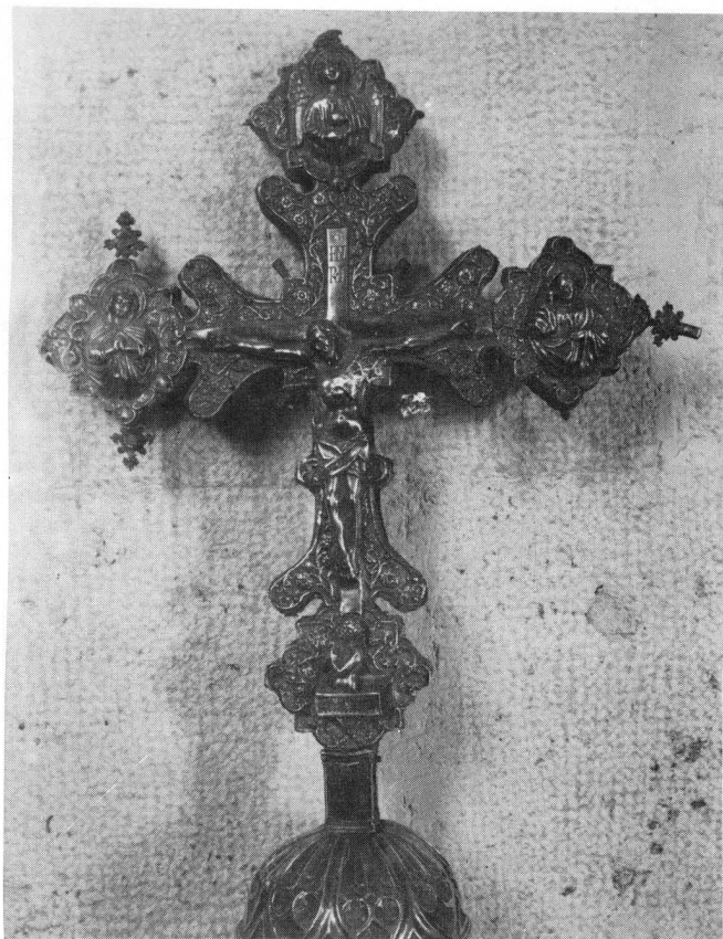
Ophodno raspelo, XV. st, Blato o. Korčula