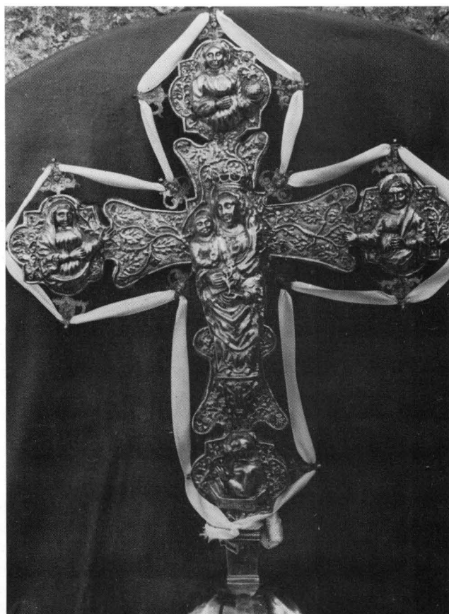
Ophodno raspelo, XV. st, Žrnovo o. Korčula

na okolnim brežuljcima. Čine ga četiri zaseoka: Prvo selo, Postrana, Brdo i Kampuš. 7 Župna crkva Sv. Martina izgrađena je na stjenovitoj uzvisini nad njima. Spominje se u arhivskim ispravama već 1329, 1359. i 1391. godine 8 , no kako je tokom stoljeća nekoliko puta pregrađivana, sasvim je izgubila prvobitni izgled. 9