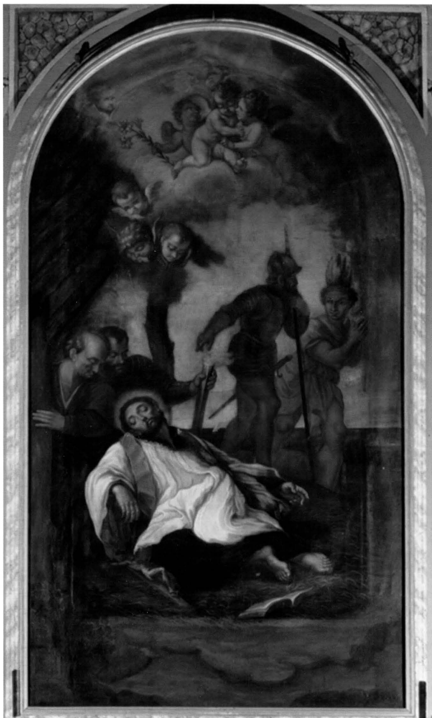
Smrt sv. Franje Ksaverskoga, Dubrovnik, crkva sv. Ignacija / Death of St. Francis Xavier, Dubrovnik, St. Ignazio