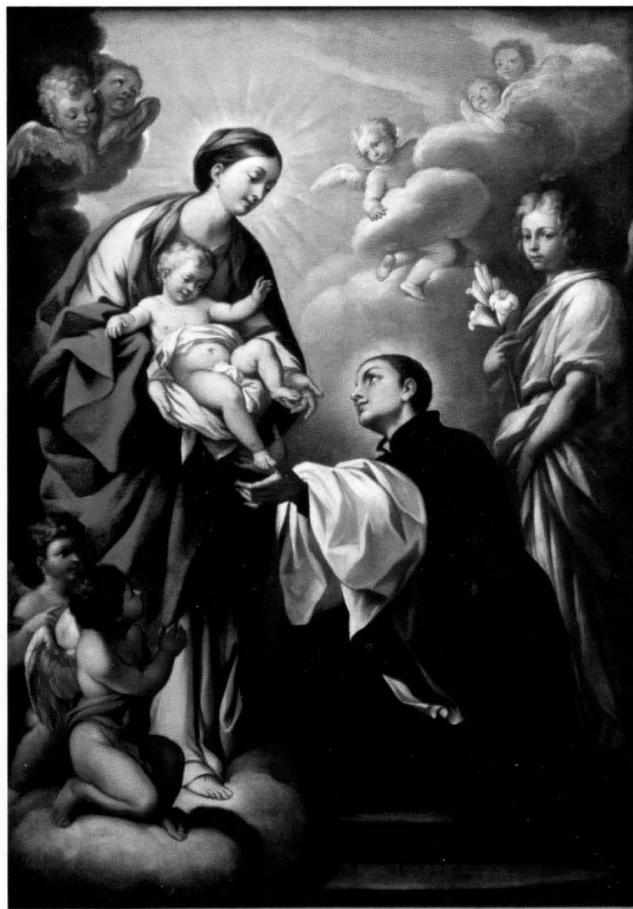
Bogorodica se ukazuje sv. Stanislavu Kostki , Dubrovnik, crkva sv. Ignacija / Virgin Appearing to St. Stanislas Kostka , Dubrovnik, St. Ignazio

4. Bogorodica se ukazuje sv. Stanislavu Kostki , Isusovački samostan. Sačuvane su dvije kopije prema oltarnoj slici koju je Maratta izradio za crkvu S. Andrea al Quirinale u Rimu. Slika je bila naručena 1676. a dovršena je tek 1687. godine, kada je prema dokumentima u arhivu Doria Pamphilj, slikaru bilo plaćeno 400 skuda. U tom je razdoblju Maratta bio iznimno zaposlen, pa njegov prijatelj i biograf Pietro Bellori navodi da je 1680–1681. godine izrađivao dvadeset dvije slike, među kojima su najbrojnije bile velike oltarne slike. Nakon toga slikar je bio toliko iscrpljen da je bio liječen, prema tadašnjim uobičajenim postupcima, ispuštanjem krvi. Bolest i liječenje uvjetovali su da je slikar kasnije s ispunjenjem dogovorenih obveza. 10