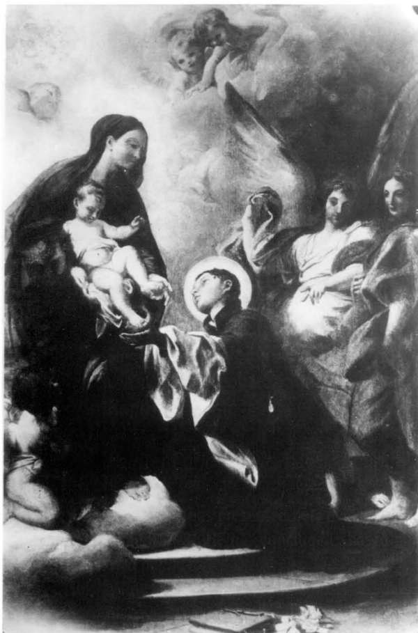
Carlo Maratta, Bogorodica se ukazuje sv. Stanislavu Kostki , Rim, S. Andrea al Quirinale / Carlo Maratta, Virgin Appearing to St. Stanislas Kostka , Rome, San Andrea al Quirinale