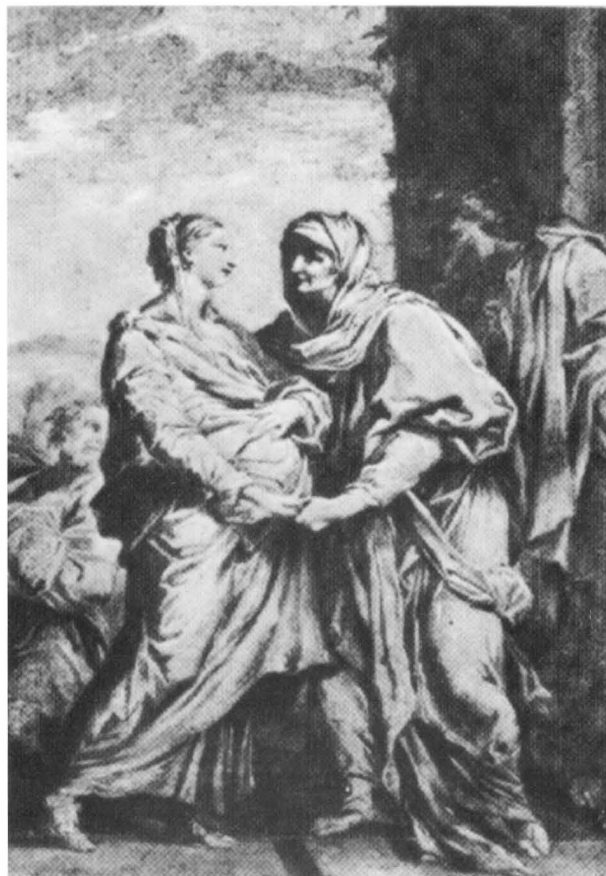
Carlo Maratta, Pohodjenje Blažene Djevice Marije Elizabeti , bakrorez / Carlo Maratta, Visitation, engraving

sini; Rim, Galleria d'arte antica, Palazzo Barberini; Stamford, Burghley House; Weimar, Schloss Museum; Padova, Museo Civico). Sam je Maratta izradio i veći broj bakropisa koji variraju temu i kompoziciju: mijenjao se položaj Bogorodičine glave, broj anđela ili lik sveca sa strane. 6