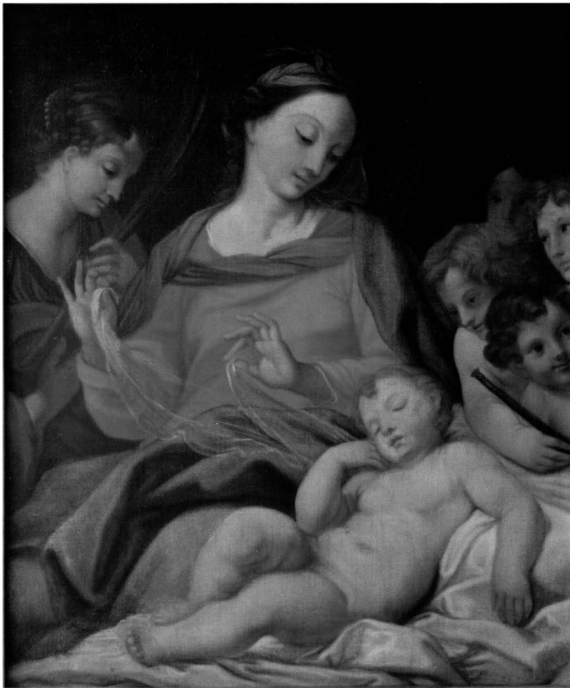
Bogorodica s usnulim kristom, sv. Katarinom Aleksandrijskom i anđelima , Dubrovnik, Isusovački samostan / Virgin with a Sleeping Christ, St. Catherine of Alexandria and Angels , Dubrovnik, Jesuit Monastery