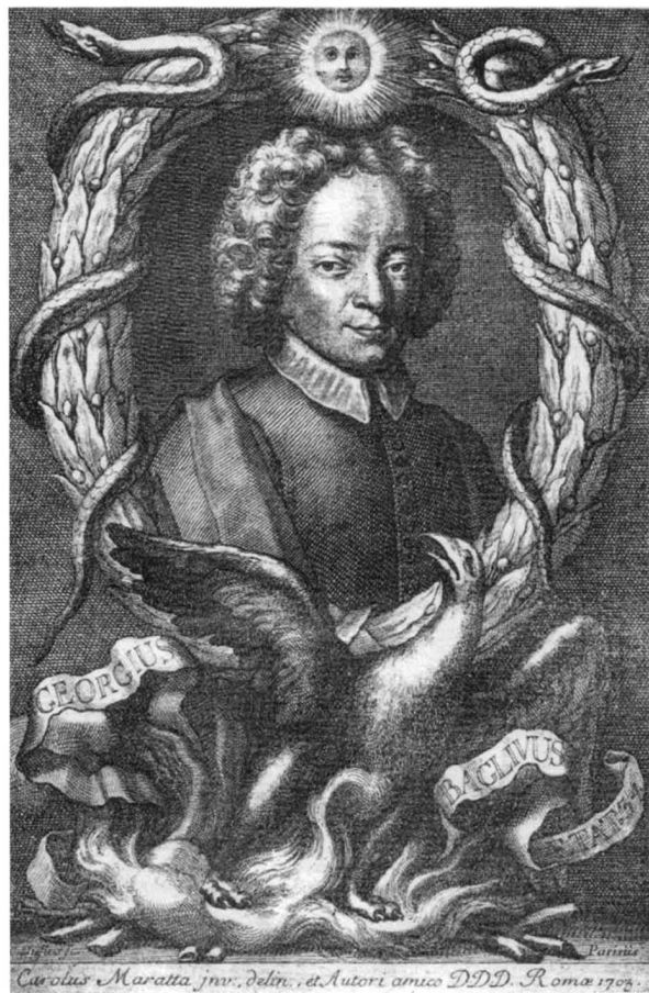
C. Maratta – C. Dufflos, Portret Đure Baglivija , bakrorez, 1704. godina / C. Maratta – C. Dufflos, Portrait of Đuro Baglivi , engraving, 1704

Baglivija, po kojemu će taj siroti dubrovački dječak dobiti i ime zamjenivši izvorno Armeno koje je označavalo zemlju iz koje se doselio njegov djed. Veze Dubrovnika i Rima bile su višestruke i odlučujuće, osobito nakon potresa 1667. godine, kada je upravo zahvaljujući Vatikanu razoreni grad bio obnovljen. Iz njega su stizali ne samo arhitekti, među kojima i projekt za crkvu sv. Ignacija koji se smatra djelom Andrea Pozza, nego i određeni broj slika za stare, obnovljene ili novosagrađene crkve.