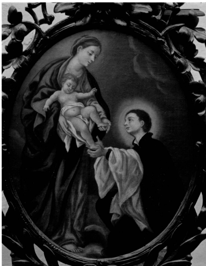
Bogorodica se ukazuje sv. Stanislavu Kostki, Dubrovnik, Isusovački samostan / Virgin Appearing to St. Stanislas Kostka, Dubrovnik, Jesuit Monastery

6. Portret dr. Đure Baglivija . Liječnik i medicinski pisac Đuro Baglivi (Dubrovnik, 1668 – Rim, 17. VI. 1707. g.) istaknuo se u Rimu, gdje je 1695. postao liječnik pape Inocenta XII (Pignatellija), a 1700. godine pape Klementa XI (Albanija). Od 1696. godine bio je profesor na rimskom sveučilištu Sapienza. 12 Lyonsko izdanje njegova djela Opera omnia medico-practica et anatomica (Lugduni, 1704. g.) sadržava i autorov portret. Bakrorez je izradio C. Duflos iz Pariza prema crtežu Carla Maratte, kako je i upisano u dnu prikaza. 13 Na portretu je prikazano liječnikovo poprsje uokvireno kružnim lovor-vijencem, oko kojega se opliću dvije zmijske. U vrhu vijenca prikazano je sunce, a u dnu iz vatre i plamena uzlijeće ptica feniks: riječ je o amblemima i simbolima koji se povezuju s medicinom, ljekarništvom i liječničkim zvanjem. Posebno je zanimljiv natpis ispod portreta: Carolus Maratta inv. delin. et Autori amico D.D.D. Romae 1704. u kojemu se navodi ne samo da je portret nacrtao