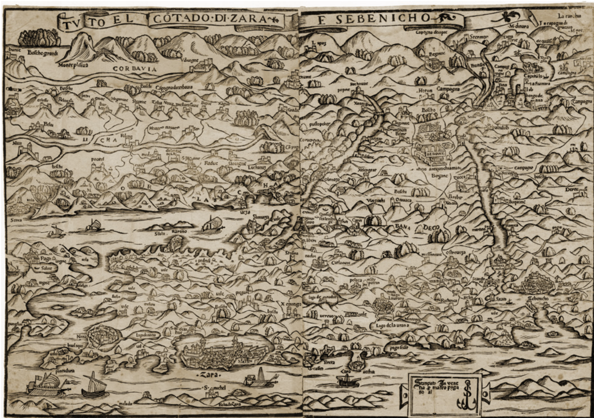
Slika 1. Zemljovid zadarske i šibenske regije nepoznatog autora, 1522./1523., Tvto el Côtado di Zara e Sebenicho , (tisak Mateo Pagano, Venecija, kasne 1530te)

A map produced in Mateo Pagano's workshop (Fig. 1), the manuscript for which is dated 1522/1523, though it was not printed until the late 1530s, during strong incursions by the Ottomans, depicts