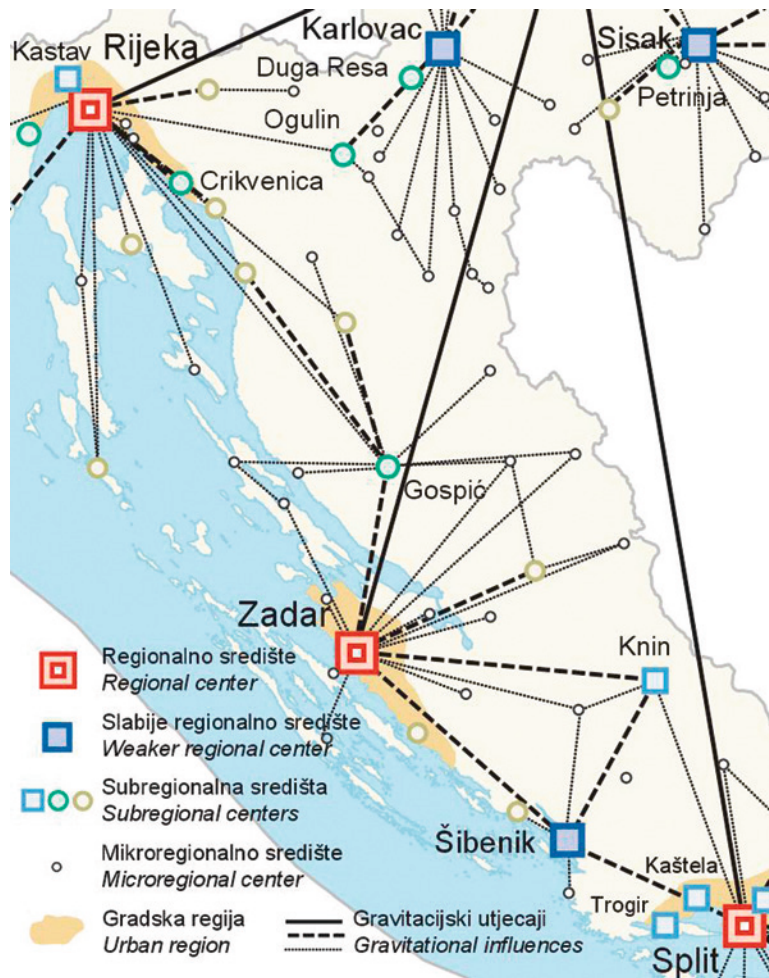
Slika 8. Shema gravitacijskih poveznica u prostoru središnjeg dijela Jadranske Hrvatske

Figure 8 Schematic depiction of gravitational links in the area of Central Adriatic Croatia