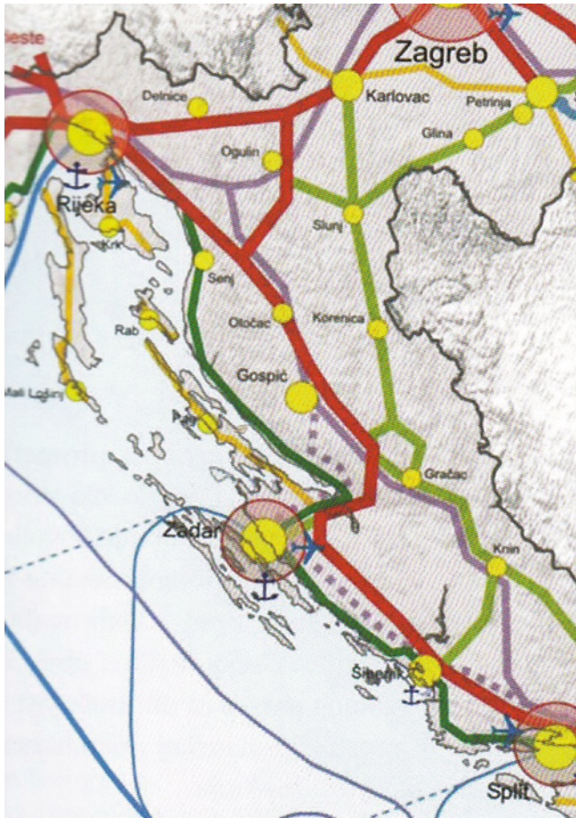
Slika 6. Središnji prostor Jadranske Hrvatske na shematskom prikazu glavnih prometnih središta Hrvatske

Figure 6 Central Adriatic Croatia – schematic depiction of main traffic centres in Croatia