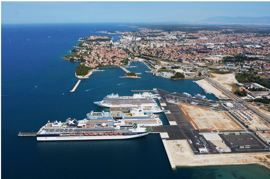
Slika 5. Trajektna luka u Gaženicama