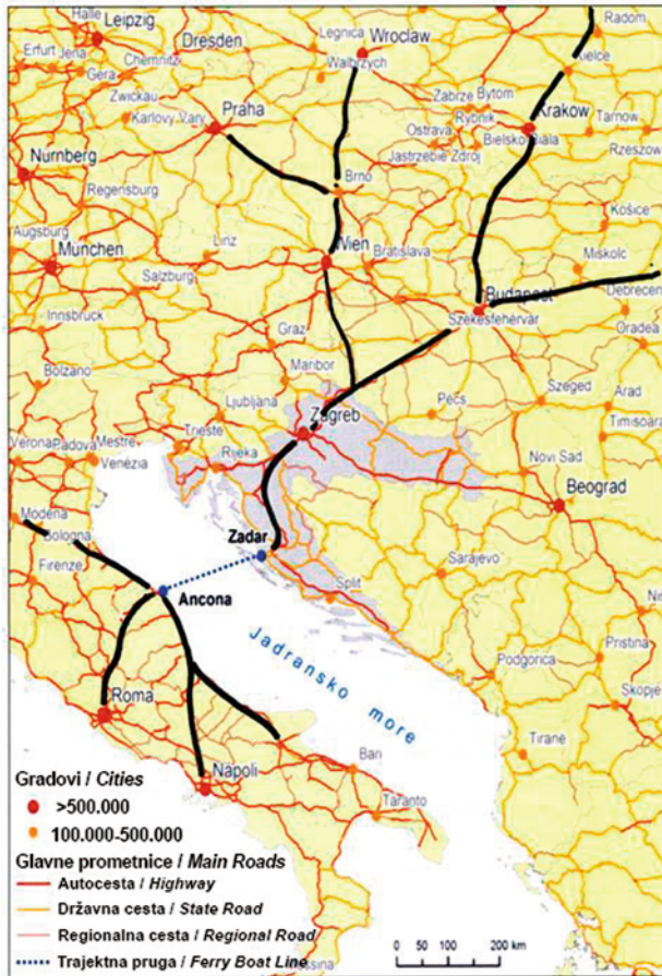
Slika 4. Shematski prikaz prometnih pravaca koji potencijalno koriste trajektnu vezu Zadar – Ancona Figure 4 Schematic depiction of transport routes potentially using the Zadar-Ancona ferry connection