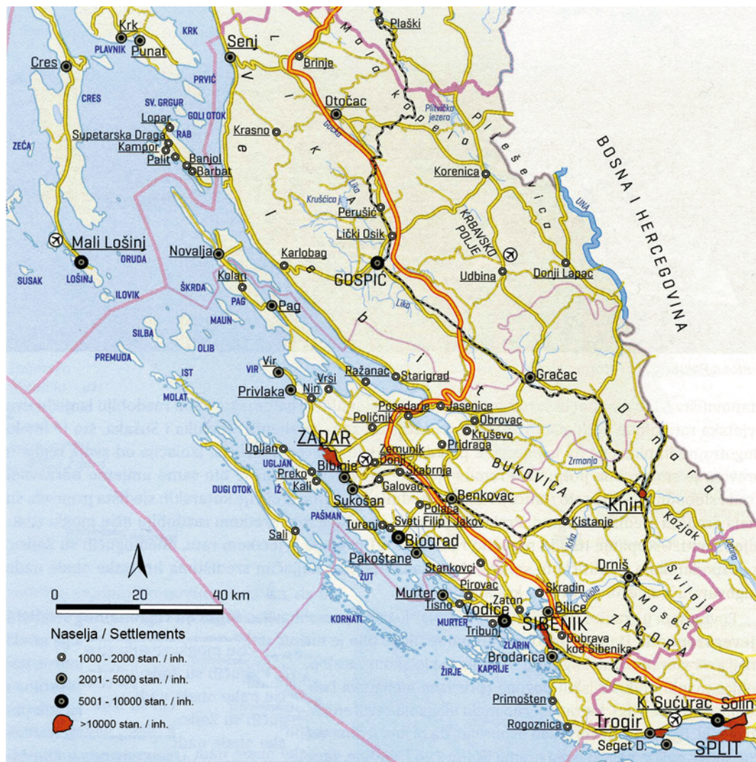
Slika 2. Središnji prostor Jadranske Hrvatske (Regionalni kompleks Lika – Sjeverna Dalmacija)