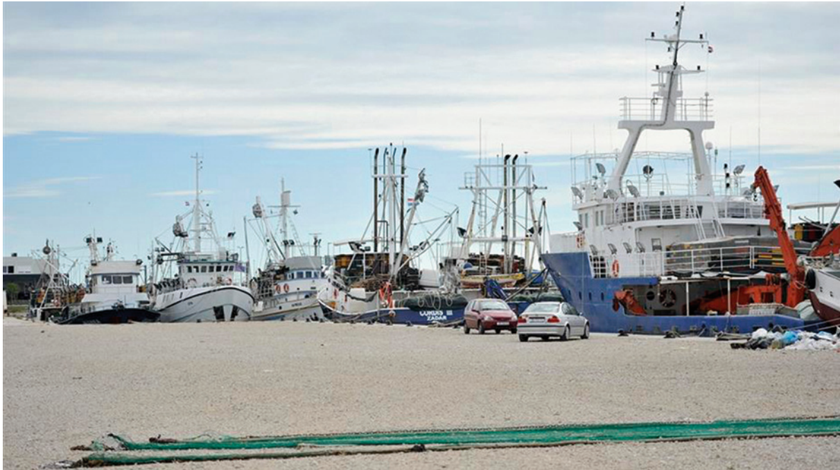
Slika 7. Ribarska luka u Gaženicama