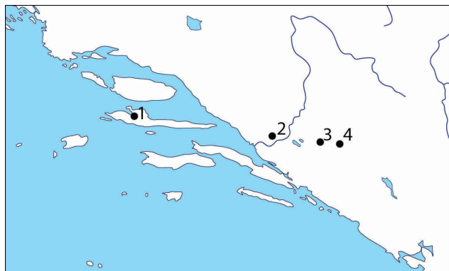
Karta 1. Rasprostranjenost daorskog novca (priredio: I. Dragičević) 1. Starogradsko polje, otok Hvar 2. Narona 3. Ošanjici 4. Suzina, Dabarsko polje

Map 1. Distribution of Daorsi coins (prepared by: I. Dragičević) 1. Starogradsko polje, island of Hvar 2. Narona 3. Ošanjici 4. Suzina, Dabarsko polje