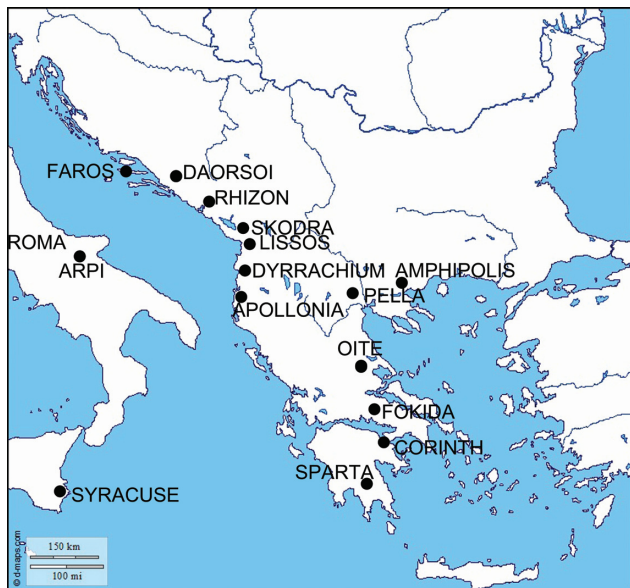
Karta 2. Novac kovnica zastupljenih na daorskom području (priredio: I. Dragičević)

Map 2. Coins from the mints present in Daorsi territory (prepared by: I. Dragičević)