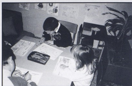
DV Krijesnica, Rijeka; Kakvih su sve boja?