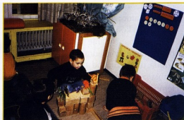
DV Krijesnica, Rijeka; Radimo veliku kuću za naše dinosaure

U ustima ima zube bijele i velike. Izgledaju kao neke male zmije. Prvo su bili mesožderi, oni dugovrati i onda kad su oni izumrli, ovi drugi su se s njima hranili. Od njihovih kostiju su nastali drugi dinosauri. Prije, kad su živjeli dinosauri, nije bilo stolica, stolova, ni igračkaka, samo grane, lišće, vulkani i more. Vidi, moj je zgnječen (dinosaur od tijesta). Vidi, zgnječio ga je Tiranosaur. Tin