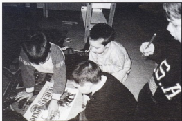
DV Krijesnica, Rijeka; Kako se ovaj zove?

Kad se naljuti, onda mu ti rogovi pocrvene pa