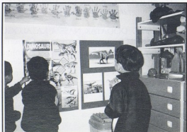
DV Krijesnica, Rijeka; Tražim ih na plakatu

Napravila sam plakat za roditelje, gdje sam najavila početak projekta i pozvala roditelje na suradnju i pomoć.