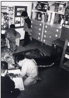
DV Krijesnica, Rijeka; Možemo ga napraviti i od kocaka

prijatelj prestraši i pobjegne. Tin, 5 god. (gledajući troroge - stegosauere)