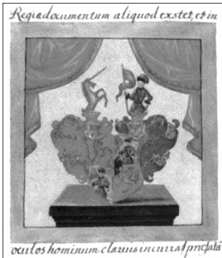
Sl. 1. Plemićki grb obitelji Vukasović