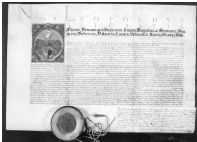
Sl. 4. Grbovnica cara Leopolda I. o dodjeli plemstva i grba senjskom vojvodi Vinku Vukasoviću iz 1667.

Godine 1665. obitelj je dobila senjsko plemstvo i bila uvedena u gradski patricijat. Odlukom Hrvatskog sabora od 5. lipnja 1719. Vukasovići su potvrđeni kao hrvatski plemići. 4 Filip Vukasović je dobio 4. rujna 1720. austrijsko carsko viteštvo. 5