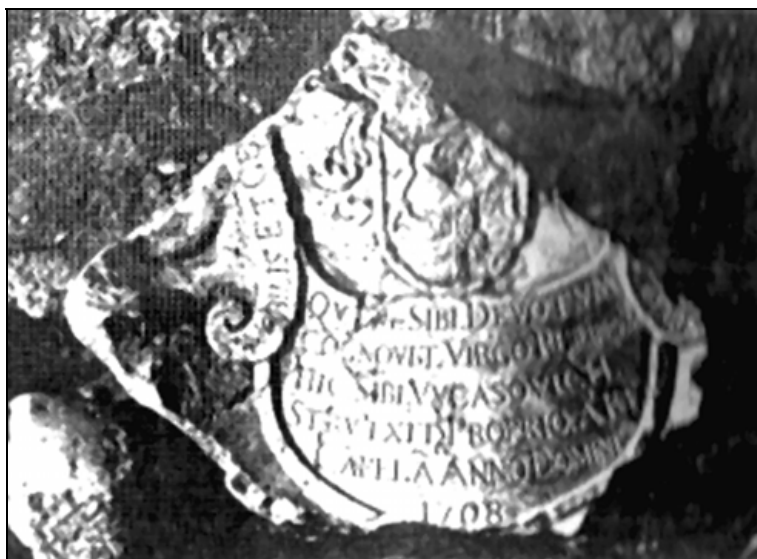
Sl. 6. Kameni grb Vukasovića (Tvrđava Nehaj)

U poznatom popisu patricijskih i građanskih obitelji Senja iz 1758. nalaze se i Vukasovići. 6