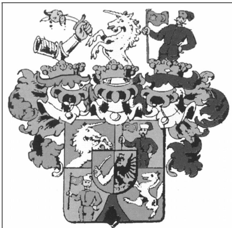
Sl. 3. Barunski grb Vukasovića

Povelju 1 o dodjeli plemstva i grba podijelio je austrijski car Leopold I. (1657. – 1705.) u Beču 28. siječnja 1667. godine senjskom vojvodi Vinku Vukasoviću, koji je još i prije ove dodjele bio plemić. 2