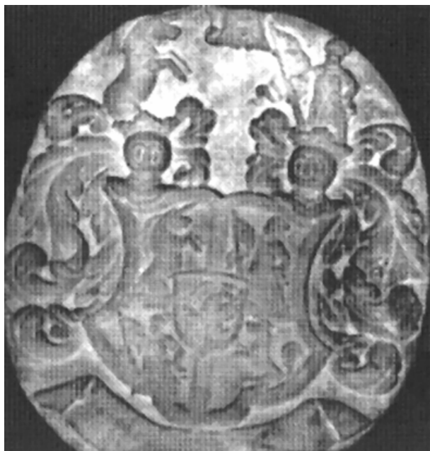
Sl. 7. Kameni grb obitelji Vukasović, katedrala B. D. M. u Senju