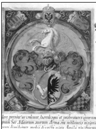
Sl. 5. Grb Vinka Vukasovića s povelje kralja Leopolda iz 1667.

Godine 1665. obitelj je dobila senjsko plemstvo i bila uvedena u gradski patricijat. Odlukom Hrvatskog sabora od 5. lipnja 1719. Vukasovići su potvrđeni kao hrvatski plemići. 4 Filip Vukasović je dobio 4. rujna 1720. austrijsko carsko viteštvo. 5