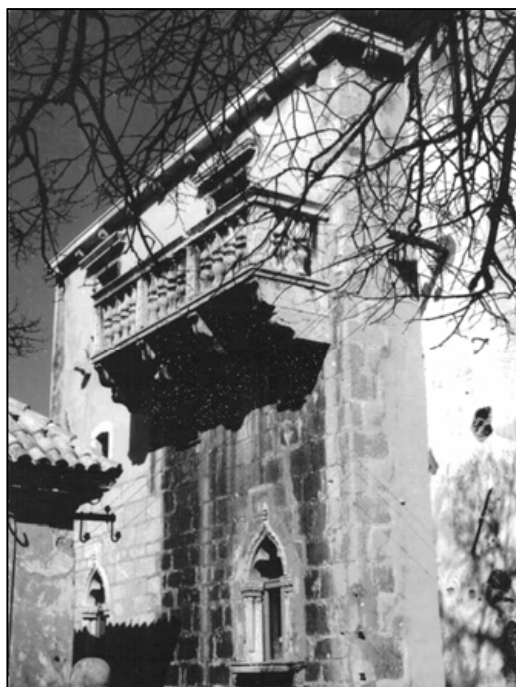
Sl. 8. Palača obitelji Vukasović (danas Gradski muzej)

Ova poznata i slavna uskočko-plemićka obitelj podrijetlom je iz Dalmacije, iz Poljica, a živjeli su u velikom broju i oko grada Klisa. U spomenute krajeve naselili su se iz Bosne nakon pada Bosne pod Osmanlije 1463. godine. U Senj su se doselili u 16. st., nakon pada Klisa 1537. pod Osmanlije. Doseljenjem u Senj stekli su veliki ugled među najutjecajnim aristokratskim obiteljima habsburških zemalja, kako obrazovanošću tako i nazočnošću u mnogobrojnim vojnim i javnim službama. U staroj povijesnoj jezgri grada sagradili su raskošnu kuću-palaču u baroknom stilu s renesansnim balkonom i pročeljem od klesanog kamena s venecijanskim i baroknim arhitektonskim elementima. 9