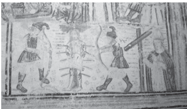
8. Zadobarje, kapela sv. Antuna, sjeverni zid lađe, Sv. Fabijan i sv. Sebastijan , 1539. / Zadobarje, chapel of St. Anthony, north wall of the nave, Saints Fabian and Sebastian , 1539

vjerojatno treba datirati na kraj 15. ili početak 16. stoljeća.