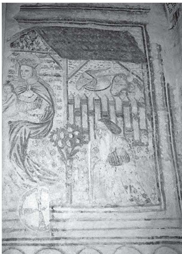
6. Maršiči pri Ortneku (Slovenija), crkva sv. Urha, sjeverni zid lađe, Poklonstvo kraljeva (detalji), tridesete ili četrdesete godine 16. stoljeća / Maršiči pri Ortneku (Slovenia), church of St Ulrich, north wall of the nave, Adoration of the Magi , 1530s/1540s ( https://picasaweb.google.com/109785782261824869224/SVURHMARI?gsessionid=6xFtT7fxcmkyljGeG9ezeg#5227635242806521970 )