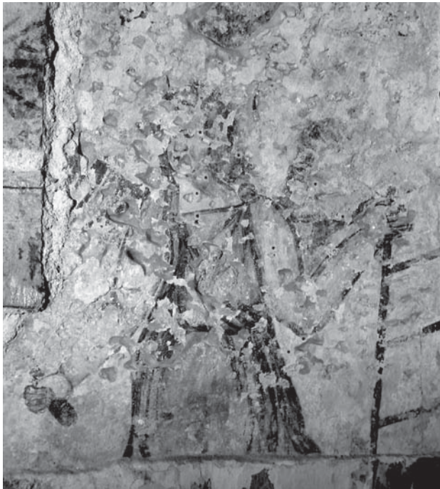
7. Žumberak, župna crkva sv. Nikole, sjeverni zid svetišta, Jakovljeve ljestve (detalj), druga četvrtina 16. stoljeća / Žumberak, parish church of St. Nicholas, north wall of the chancel, Jacob's Ladder (detail), second quarter of the 16 th century