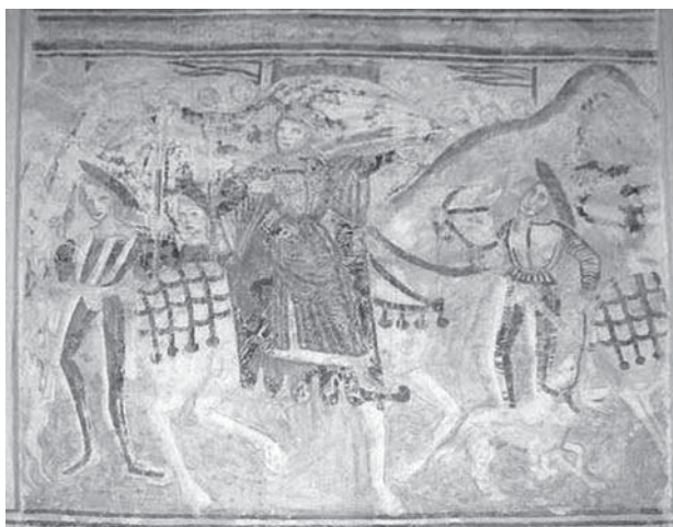
3. Zadoborje, kapela sv. Antuna, sjeverni zid lađe, Poklonstvo kraljeva (detalj), 1539. / Zadoborje, chapel of St Anthony, north wall of the nave, Adoration of the Magi , 1539