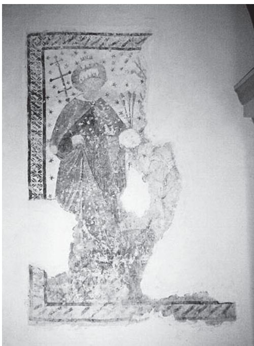
9. Trg kod Ozlja, kapela Svih Svetih, sjeverni zid lađe, Sv. Fabijan i sv. Sebastijan , kraj 15. ili početak 16. stoljeća / Trg near Ozalj, chapel of All Saints, north wall of the nave, Saints Fabian and Sebastian , late 15 th or early 16 th century