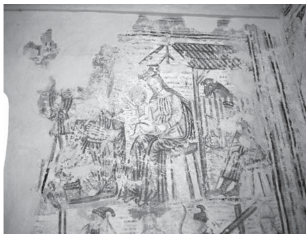
5. Zadobarje, kapela sv. Antuna, sjeverni zid lađe, Poklonstvo kraljeva (detalji), 1539. / Zadobarje, chapel of St Anthony, north wall of the nave, Adoration of the Magi , 1539

Nedaleko od tih lokaliteta nalazi se kapela Svih Svetih u Trgu kod Ozlja, gdje je na sjevernom zidu lađe fragmentarno sačuvana zidna slika s likovima sv. Fabijana i sv. Sebastijana. 27 Slikana je ograničenom skalom zemljanih boja u kojoj prevladavaju crvene i narančaste nijanse. Za razliku od zidnih slika iz skupine u Zadobarju, Volavju i Sveticama, gdje upotrebu jednostavne skale zemljanih boja prati i jednostavan likovni izraz majstora, u Trgu se u načinu na koji je korištena ovako skromna skala boja, da bi u kombinaciji s bijelom bojom bio ostvaren prizor monumentalnog utiska, prepoznaje rad kvalitetnog majstora. Blago sjenčanje nabora i slikanje bijele pozadine, kao i izdvajanje prikaza sa svetačkim likovima na sjevernom zidu lađe, obilježja su kasnog gotičkog slikarstva, pa tu zidnu sliku