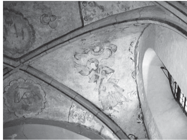
2. Novigrad na Dobri, župna crkva Uznesenja Marijina, svod svetišta, Anđeli svirači , kraj 15. ili početak 16. stoljeća / Novigrad na Dobri, parish church of the Assumption of the Blessed Virgin Mary, chancel vault, Musician Angels , late 15 th or early 16 th century

kod Ozlja. Posebnu skupinu zidnih slika na tom području predstavljaju one koje se mogu povezati uz ciklus u kapeli sv. Antuna u Zadobrarju, a uključuju i zidne slike u župnoj crkvi Rođenja Marijina u Sveticama i proštenjarskoj kapeli sv. Marije Snježne u Volavju. 5 Uz tu skupinu smatram da se može povezati i nedavno otkriveni fragment u župnoj crkvi sv. Nikole u Žumberku.