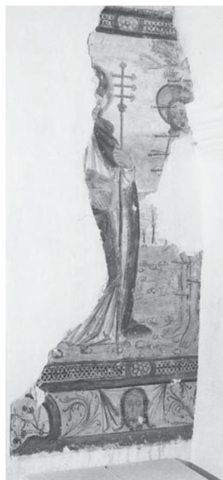
10. Dolenje Kronovo (Slovenija), crkva sv. Nikolaja, Sv. Fabijan i sv. Sebastijan , oko godine 1500. / Dolenje Kronovo (Slovenia), church of St Nicholas, Saints Fabian and Sebastian , c. 1500 (Janez Höfler, Srednjeveške freske v Sloveniji, Okolice Ljubljane z Notranjsko, Dolenjsko in Belo krajino , III, Ljubljana 2001, fig. 16)

nosno do Petrovine, koja se smatra krajnjom točkom dopiranja glagoljice na sjever, 36 vjerojatno možemo povezati sa širenjem frankopanskih posjeda. U Ozlju je 3. svibnja 1437. knez Bartol Frankopan izdao ispravu pisanu glagoljicom, u kojoj »plemenitim purgarima slobodnoga Trga našega«, daje »žirov'no is'pašće, ... da uživaju i raduju spored', našimi kmeti u Mirkovom polju«. 37