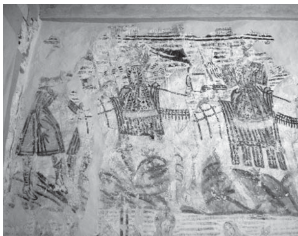
4. Maršiči pri Ortneku (Slovenija), crkva sv. Urha, sjeverni zid lađe, Poklonstvo kraljeva (detalj), tridesete ili četrdesete godine 16. stoljeća / Maršiči pri Ortneku (Slovenia), church of St Ulrich, north wall of the nave, Adoration of the Magi , 1530s/1540s ( https://picasaweb.google.com/109785782261824869224/SVURHMARI?gsessionid=6xFtT7fxcmkYjGeG9ezeg#5227635194043968642 )

Dodirne točke mogu se primijetiti i u slikanju kraljeva na konjima. U Maršičima je dio prizora sa srednjim kraljem uništen kasnijim probijanjem prozora, ali se u liku posljednjeg, najmlađeg kralja uočavaju brojne sličnosti s posljednjim kraljem u povorci u Zadoborju. Osim već spomenutih dodirnih točaka u slikanju bijelih konja s crvenom ormom, koje su zajedničke svim prizorima Poklonstva iz te skupine, može se primijetiti i sličnost u slikanju konja u profilu i kralja koji je u poluprofilu smješten na konju na pomalo nespretan način. Njegove noge slikane su u profilu, a gornji dio tijela i glava okrenuti su prema naprijed. Sličan je i položaj kraljevih ruku, u Maršičima kralj ima desnu ruku savijenu u laktu, a lijevu ispruženu prema naprijed, dok su ruke kralja u Zadoborju u istom položaju, ali u obrnutom rasporedu.