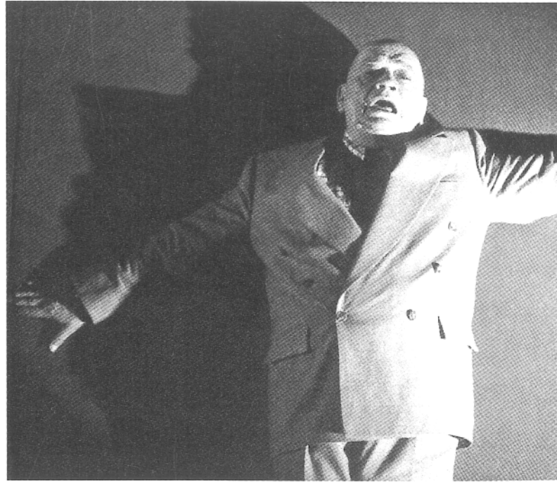
Konjic iz Chicoutmija ( Dragonfly of Chicoutimi )

A u posljednjih deset godina scenu u Québecu je potresla umjetnost kojom dominira ideja da se publika može prepoznati, identificirati, u kazalištu koje, u velikoj mjeri, nije više zadovoljno time da bude zrcalo. Promjena je u njega ušla na sva vrata. I, najednom, razbila u komadiće poznato Zrcalo na sceni ( Miroir sur la scene ) koje je ujedno i naslov