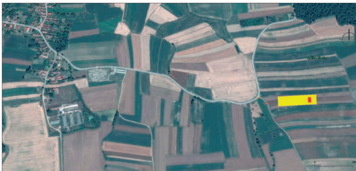
Sl. 1 Položaj arheološkog nalazišta Velike Hlebine jugoistočno od Hlebina u Koprivničko-križevačkoj županiji: žuto – površina geofizičkih istraživanja; crveno – površina sonde S-1 (izradila: K. Turkalj)