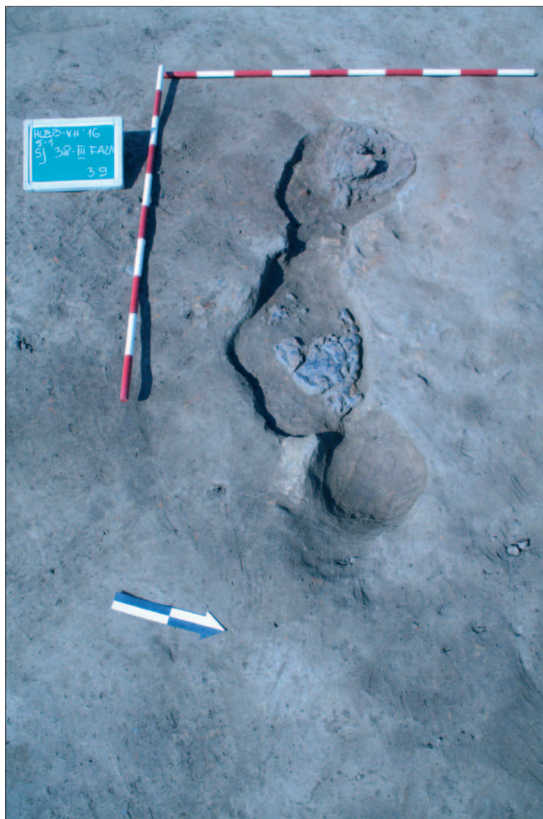
Sl. 2 Ostaci južnije pozicionirane talioničke peći (SJ 038) s ostacima in situ zgure u ložištu i kanalicu