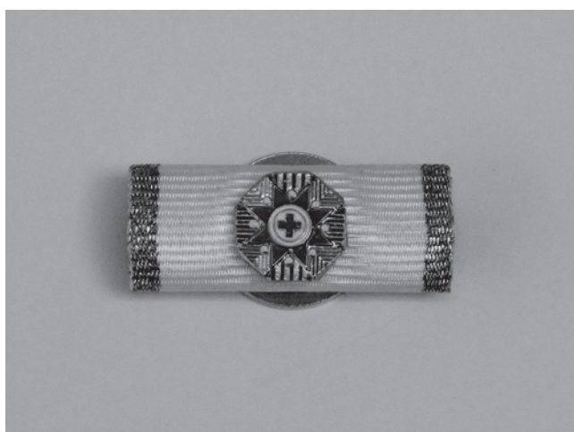
Slika 4. Mali znak Velereda HCK