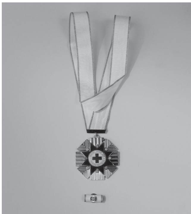
Slika 3. Velered HCK s malim znakom