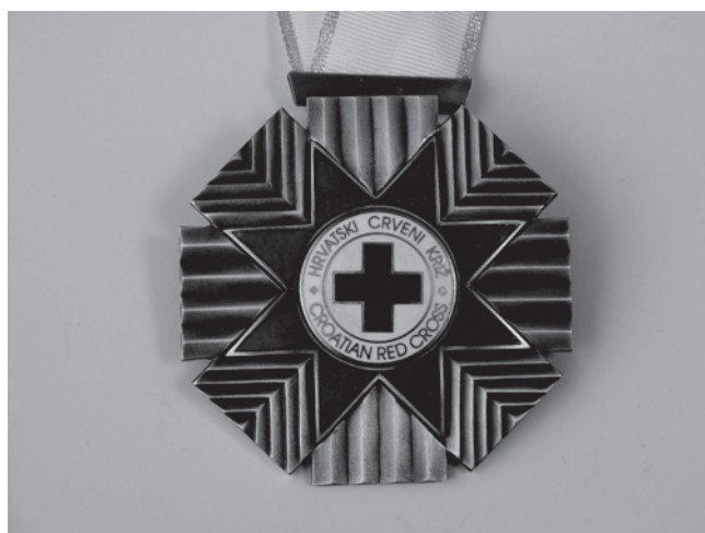
Slika 7. Znak Reda HCK