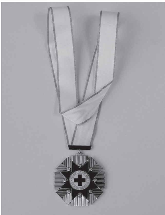
Slika 1. Velered HCK