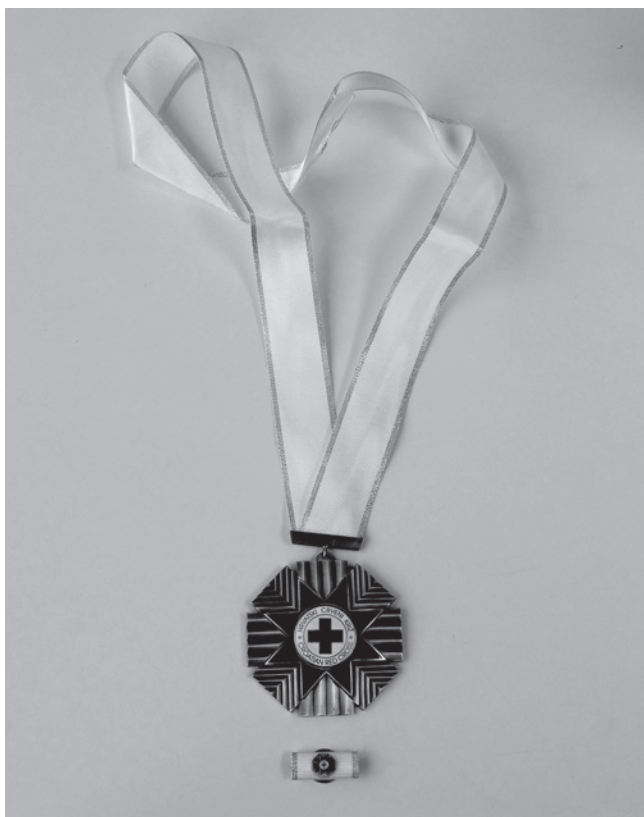
Slika 8. Red HCK s malim znakom