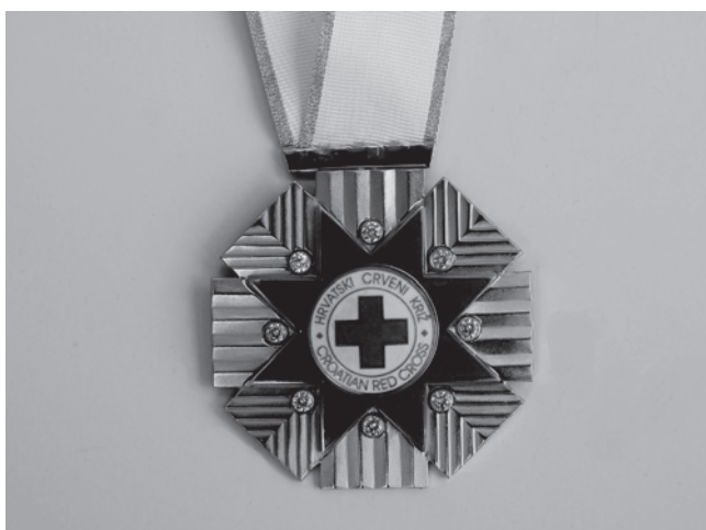
Slika 2. Znak Velereda HCK