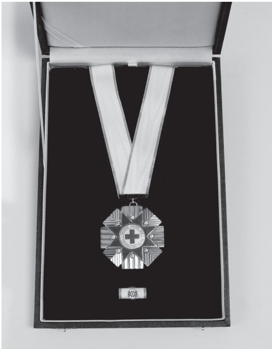
Slika 5. Velered HCK u etuiju

Križa i doprinos Međunarodnom pokretu Crvenog križa i Crvenog polumjeseca; ili za pruženu pomoć i potporu; ili za istrajni, dugogodišnji, dobrovoljni rad i zalaganje za ostvarivanje ciljeva Hrvatskog Crvenog Križa; ili za 30 i više godina neprekidnog aktivnog rada, djelovanja i doprinosa.“