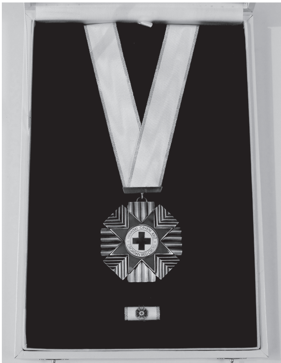
Slika 10. Red HCK u etuiju