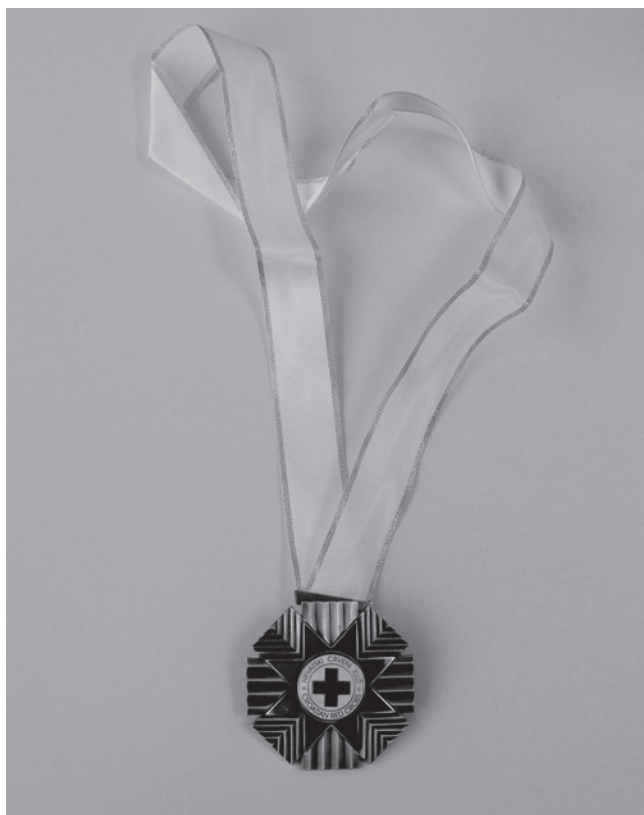
Slika 6. Red HCK