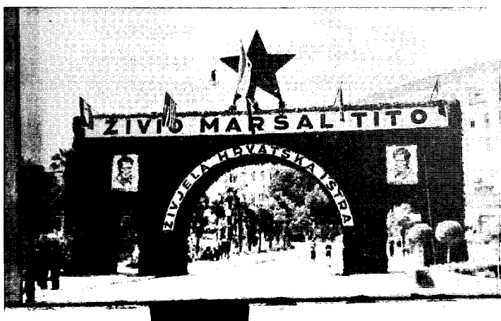
Fotografija 1: Slavoluk postavljen u Pazinu uoči dolaska Međunarodne komisije za razgraničenje.

No, niti istaknuta partijska ikonografija vidljiva na ovakvim slavlucima, niti plesanje Partizanskoga kola, pa niti izvođenje partizanskih pjesama nisu