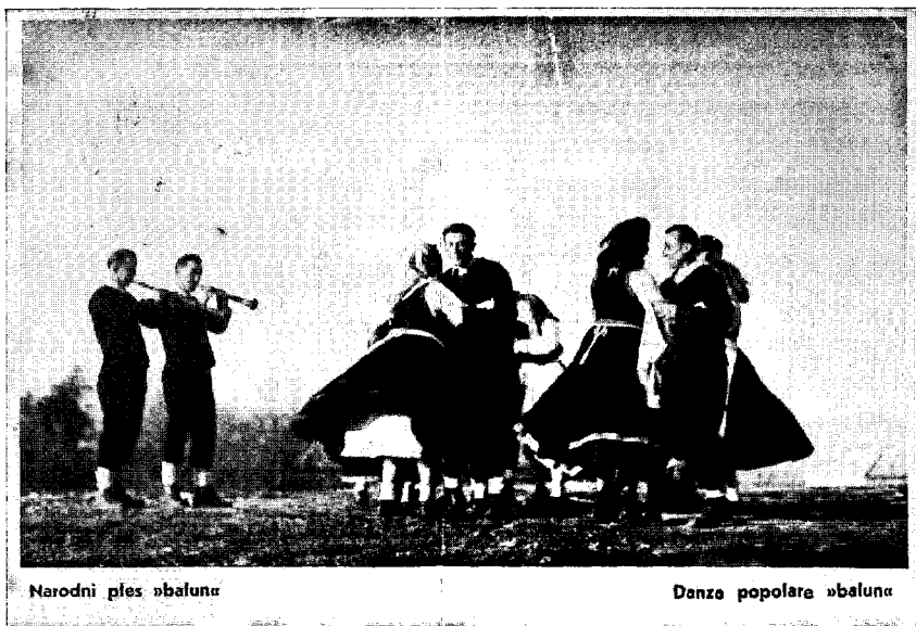
Fotografija 3: Sopci u roženice i plesači baluna.