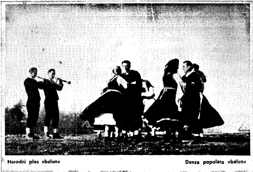
Fotografija 3: Sopci u roženice i plesači baluna.