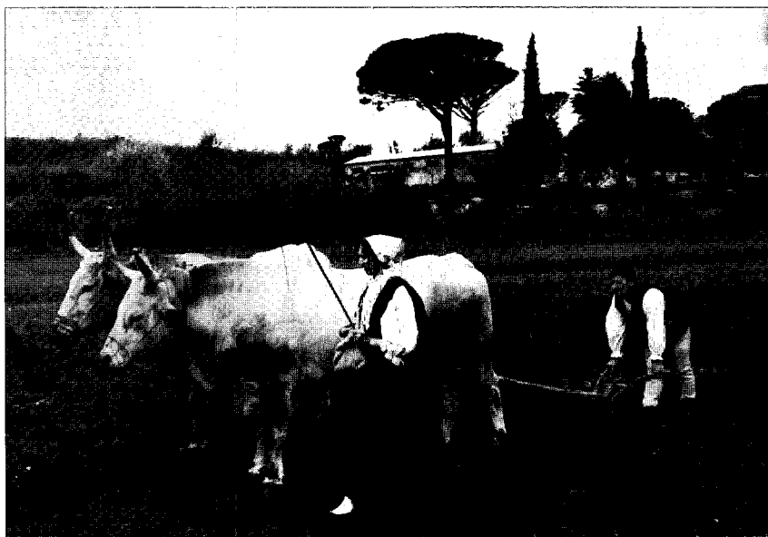
Fotografija 2: Oranje s boškarinima.