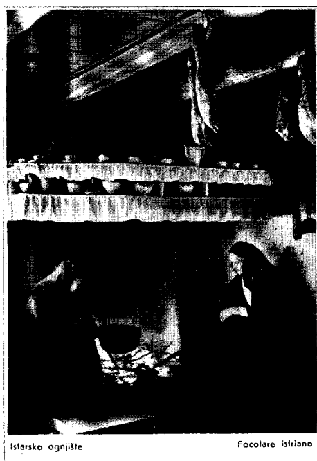
Fotografija 5: Kraj ognjišća.