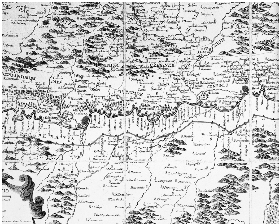
Slika 2: Dio karte razgraničenja I. Berndta nastale nakon Požarevačkog mira 1718. godine

poslije 1739. godine počelo obnavljati. Važnost Broda je uvijek manje ili više bila povezana s činjenicom da su se na njegovu području susjecali putevi koji su povezivali gornju i donju Posavinu te Panonsku nizinu s Bosnom i jadranskim primorjem. 21