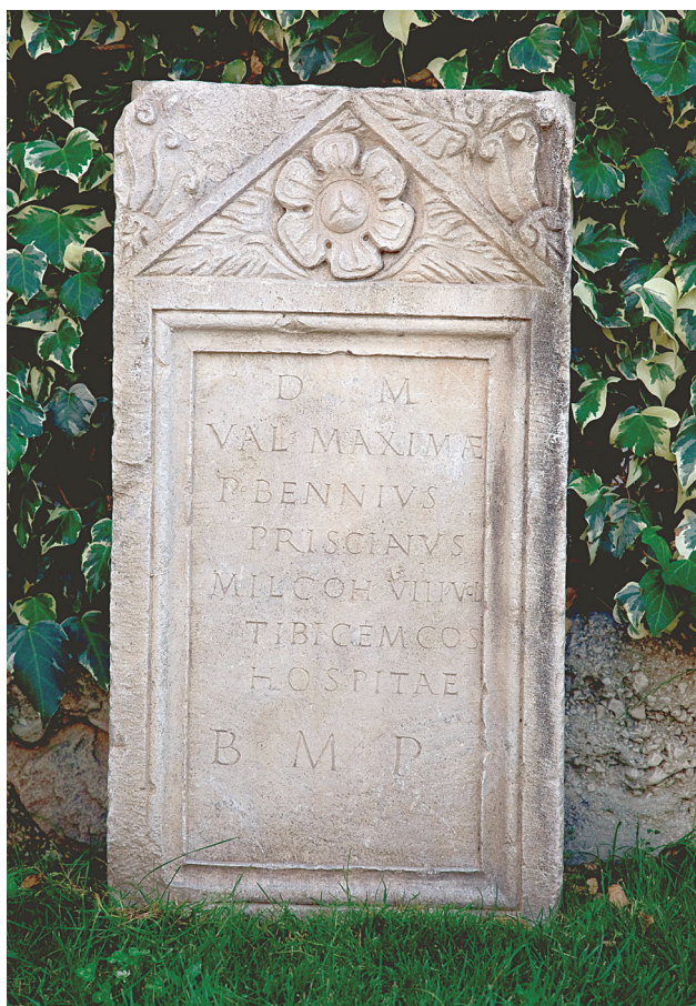
Slika 3 Stela Publija Benija Priscijana, zbirka M. Matijevića