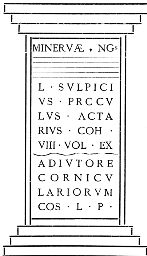
Slika 2 Ara Lucija Sulpicija Prokula (F. Bulić 1903, str. 129.)

su časnici koji su ih redovito naslovljavali vrhovnim božanstvima. 83 Rečeno potvrđuje i ovaj natpis čiju važnost pojačava podatak o skromnim potvrdama Minervina kulta u Dalmaciji. 84 O namjesnikovim kornikularijima iz Salone znamo vrlo malo jer su poznata samo dva prilično