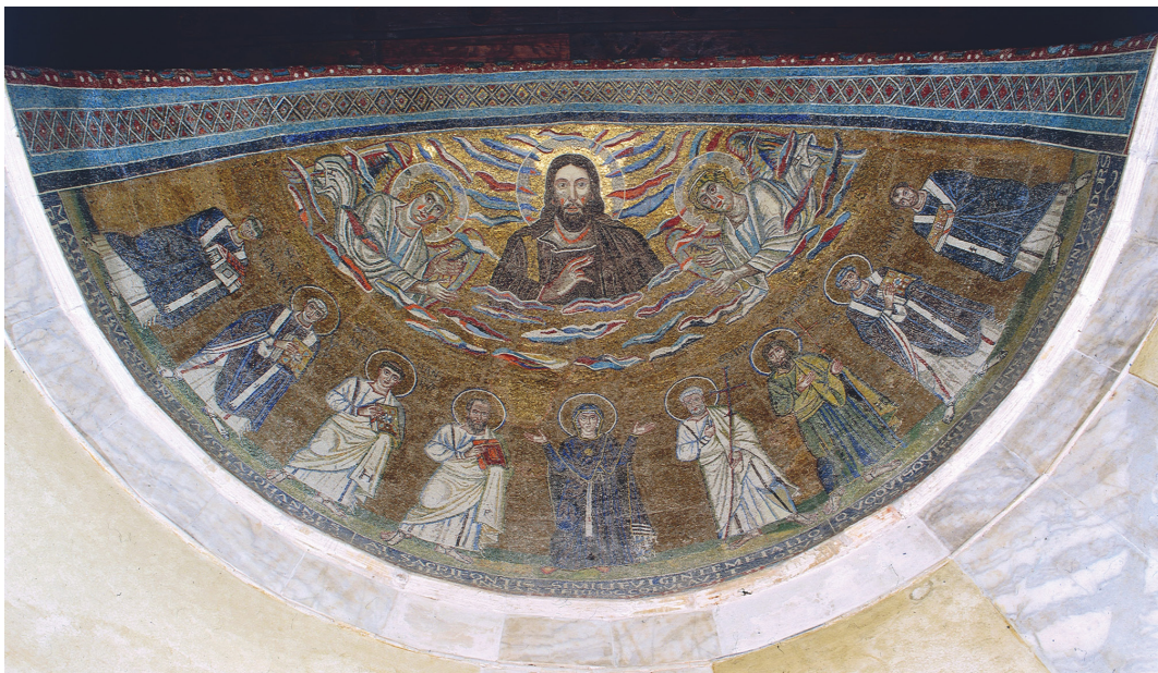
Slika 3 Mozaik u lateranskoj kapeli sv. Venancija u Rimu, apsida (A. Brachetti)