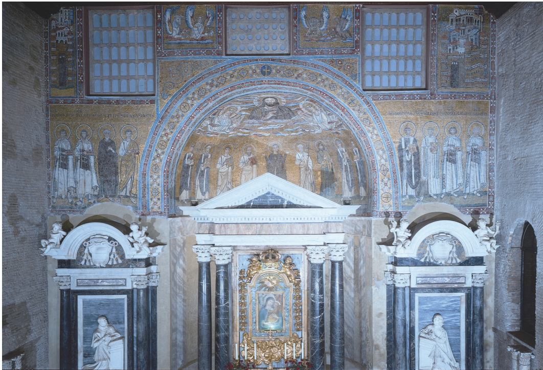
Slika 2 Mozaik u lateranskoj kapeli sv. Venancija u Rimu (A. Brachetti)