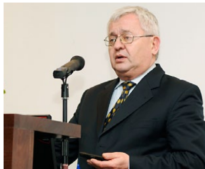
Na otvorenju kongresa nazočne je pozdravio predsjednik Hrvatskog liječničkog zbora prof. dr. sc. Željko Metelko

Na kongresu, održanom pod pokroviteljstvom Vlade Republike Hrvatske, sudjelovalo je oko 200 sudionika raznih struka koji se bave unapređenjem i zaštitom mentalnog zdravlja. Uz psihijatre, aktivno su sudjelovali liječnici obiteljske medicine kao i liječnici drugih specijalnosti, psiholozi, socijalni radnici, defektolozi, radni terapeuti, medicinske sestre, duhovnici, novinari i predstavnici vladinih i nevladinih udruga te institucija. Nakon kongresa, predsjednica Vlade sastala se u Banskim dvorima s članovima Organizacijskog odbora kongresa, koji su izrazili zahvalnost za potporu u organizaciji događanja, te najavili donošenje Rezolucije o mentalnom zdravlju RH koja bi se trebala ukoro uputiti Hrvatskom saboru.