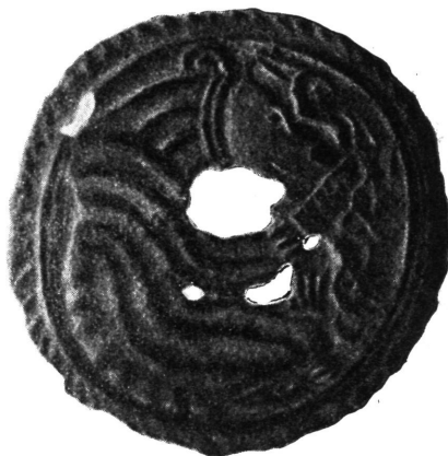
Ukrasna pločica. Perm.

U centralnoj Rusiji je od stanovite važnosti rana brončana Fatjanovo kultura, dok je za istočnu Rusiju bitna Ananjino kultura