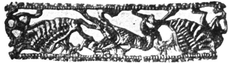
Ukrasni okov. Pontska nizina.