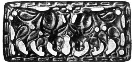
Ukrasna pločica. Minusinsk (Sibir).

ćaju na skitski način. Štaviše, možemo zamijetiti čak i klasične utjecaje, o čemu govori kurgan Katanda na Altaju (1 st. pos. Kr.), u kojem nailazimo, uz uobičajeni kovinski inventar, još na jednu tkaninu sa stiliziranim životinjskim motivima. Oni spadaju u istu epohu iz koje je i pusteni ćilim sa životinjskim aplikacijama u hunskom grobu u Noin-Ula gorju u Mongoliji. (Tekstil je dakako važan proizvod nomadske umjetnosti, te ćemo se na njega osvrnuti drugom prilikom.) Time svršava uglavnom predturska kultura centralnog Sibira. Kasniji nalazi svjedoče, da su turski narodi Din-Lin — vjerojatno pređi Kirgiza, koji su došli ovamo u 3 st. pos. Kr. — poprimili mnogo sarmatskih utjecaja, a valjda i njihov vladajući sloj. Ostali dio Sibira, pogotovo sjeverni krajevi, još su paleo-arheološki nedovoljno ispitani.