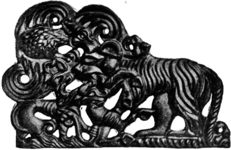
Ukrasna pločica. Sibir.