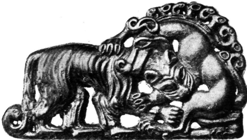
Ukrasna pločica. Sibir.