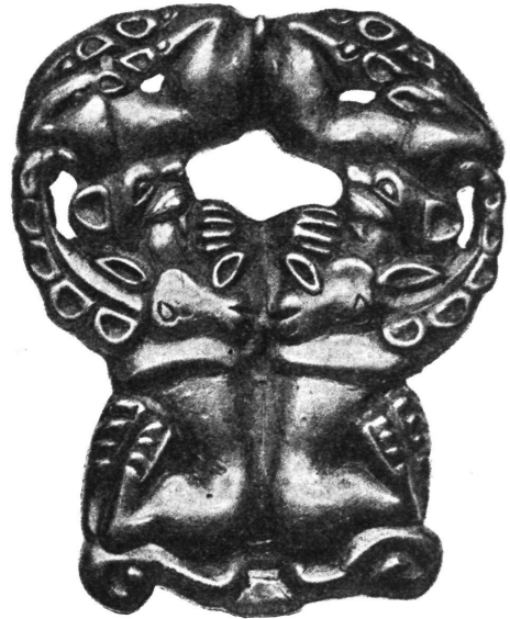
Ukrasna kopča. Pontska nizina.