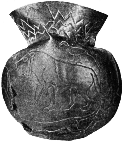
Vaza. Maikop (Kuban).