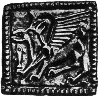
Ukrasna pločica. Krim.